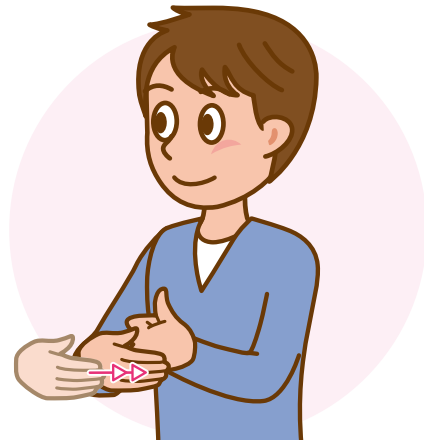
②左手は軽く握ったまま親指を立て、右手で左手甲を水平に2回たたく