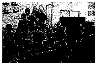
【交通安全教室・琴浦大山】