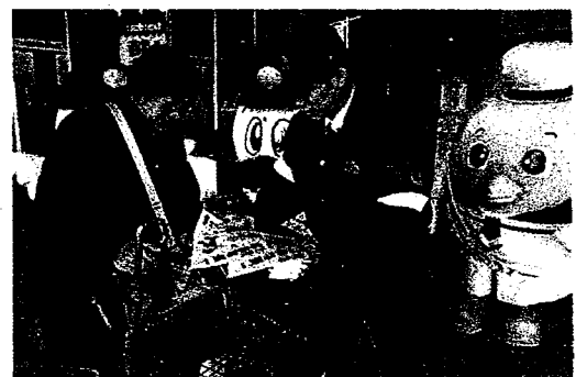
年金支給日における広報活動 (平成30年・鳥取署)