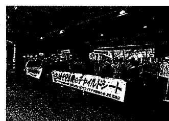
【交通安全運動開始式・鳥取】