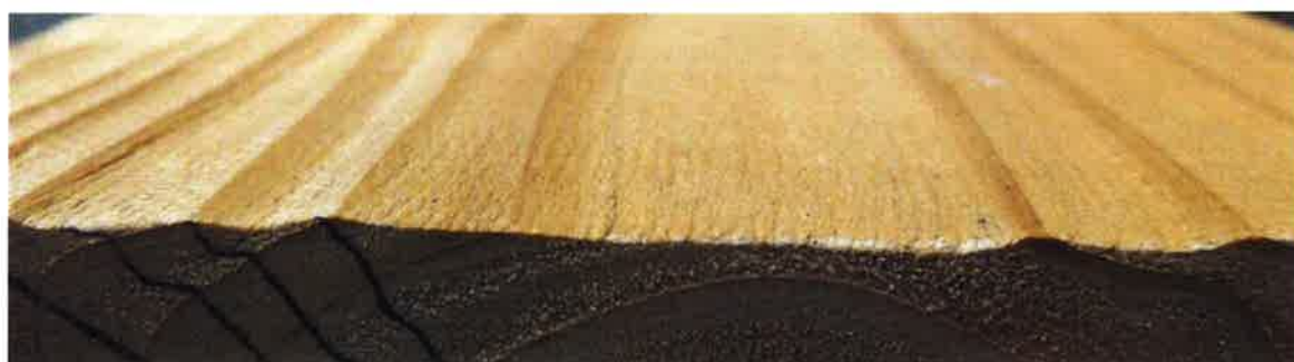
図2 選択的表層圧密「うづくり圧密(仮称)」材の表面性状