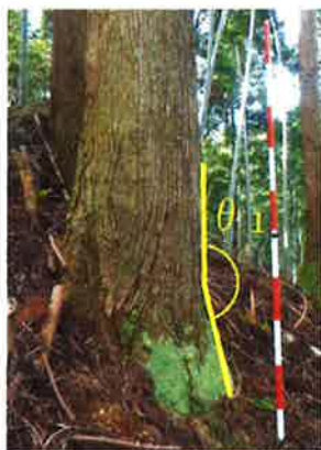
図 1 スギの根元角度の違い