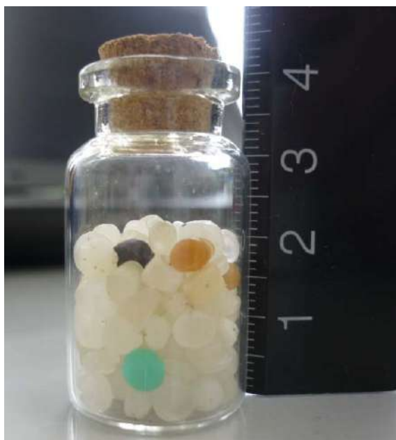
写真3 浦富海水浴場で拾ったペレット (2017年9月6日採取)

写真3は岩美町浦富 いわみちようらどめ の海水浴場で10分程度の間に拾ったもので、ビンの中には138個のペレットが入っています。たくさんレジンペレットが、山陰海岸ジオパークの海岸にも漂着していることが容易に想像できると思います。レジ袋や発泡スチロールの箱、プラスチック製品、飲料用缶などの目に見えるごみは景観を台無しにし、山陰海岸ジオパークの魅力を半減させます。これらのごみは、海岸清掃活動で拾い集めることができますが、ペレットのような見つけることが難しく、人手では回収することが難しいごみも徐々に海岸 たいてき に堆積し、環境へ影響をもたらすと考えられます。