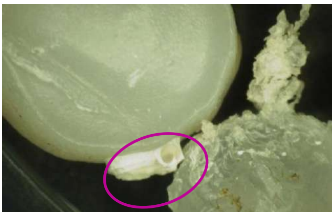
写真 2 ペレット表面の生物痕