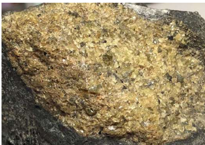
写真2 マントルからやってきたかんらん岩(唐津高島産) (写真の横幅は約50mm)

山陰海岸ジオパークの中にも、かんらん石を含む火山岩がいたるところで見られます。兵庫県では玄武洞や神鍋山、鳥取県では扇ノ山や青谷の玄武岩が知られています。これらの火山岩に含まれるかんらん石は、斑晶といってマグマが冷える早い段階できた鉱物です。しかし、火山岩の中のかんらん石の斑晶は大きさが1mm以下で、顕微鏡を使わ