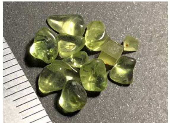
写真1 ペリドットの外観 (スケールの目盛は1mm)

前号はハワイの話でしたが、ハワイの山々(島々)を作っているのは玄武岩という岩石です。上部マントルの地下の深いところできたマグマが地表に出てきて、流れ出して固まったのが玄武岩です。この玄武岩を構成している鉱物(岩石を作っている結晶)の一つに「かんらん石」があります。玄武岩を偏光顕微鏡で観察すると、青や紫、ピンクなどに色づいて見える少し大きな鉱物がかんらん石です。英語では Olivine (オリビン) と呼ばれ、肉眼ではオリーブ色をした鉱物です。このかんらん石の大きくて、きれいな結晶(宝石級!)がペリドットと呼ばれる8月の誕生石です(写真1)。最近では、ショッピングセンターのストーン売り場や博物館のミュージアムショップで、きれいなペリドットを見かけることがあり、皆さんの中にも持っていらっしゃる方がいるかも知れません。