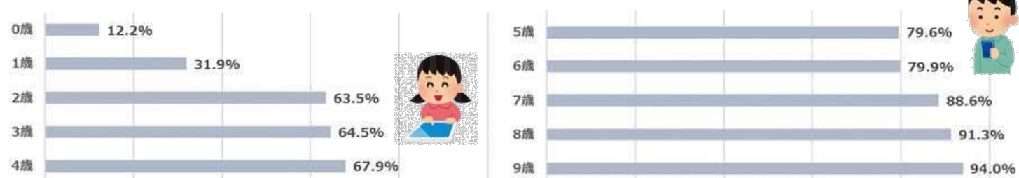
年齢別の子どものインターネット利用状況

近年は、乳幼児期からネット環境に接していることなどから、インターネット利用の低年齢化が進んでいます。利用に夢中になるあまり、日常生活や健康に影響がでてしまう「ネット依存」の低年齢化も危惧されています。