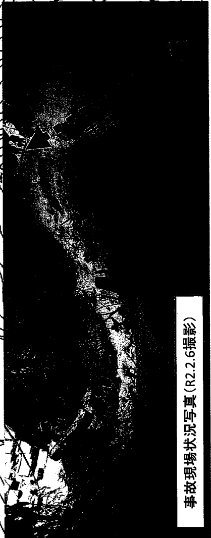
事故現場状況写真(R2.2.6撮影)