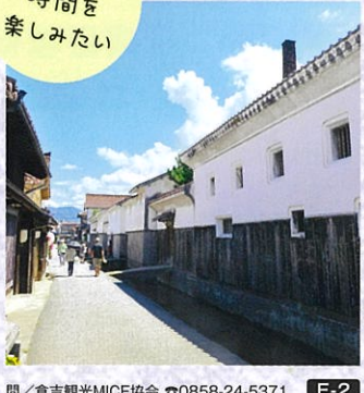
問/倉吉観光MICE協会 ☎0858-24-5371 E-2

白壁土蔵群は、明治、江戸期に建てられたものが多く、今でも当時の面影を見ることができ、国の重要伝統的建造物群保存地区に指定されています。白い漆喰壁に黒の焼き板杉、屋根には赤い石瓦、かつて造り酒屋や醤油屋だった建物が、今では物産館や喫茶店などで利用され、伝統とレトロな魅力に出会う散策ができます。