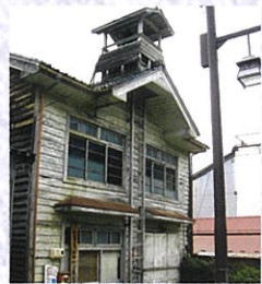
問/智頭町観光協会 ☎0858-76-1111 G-4

江戸時代は、鳥取藩主が参勤交代を行う街道「上方往来」が通り、大変賑わった宿場町です。中でもひととき豪華な佇まいを見せる石谷家はかつての山林王。敷地面積3000坪、部屋数40余りによって構成されています。智頭杉をはじめ各所の名木をふんだんに使い、技をこらし、贅をつくした広大な和風建築です。