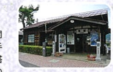
↑ライダーの聖地「集駅」