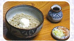
↑地元産の絶品お蕎麦