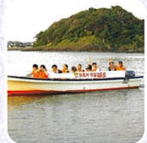
↑加茂川・中海遊覧船

江戸時代から「山陰の商都」と呼ばれ、水運拠点として栄えました。市内を流れる旧加茂川の両岸には当時を偲ぼせる古い蔵や豪商の家が立ち並び、当時の面影を残しています。九つのお寺が立ち並ぶ寺町通りや加茂川周辺に祀られた26体のお地藏さまを探しながら散策する「地藏さん巡り」も人気です。