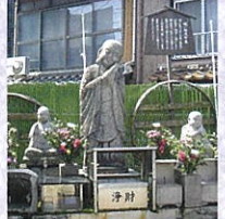
問/米子市観光協会 ☎0859-37-2311 B-2