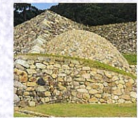
問/鳥取市観光コンベンション協会 ☎0857-26-0756 G-2

久松山を中心に山城であった鳥取城。山頂に山上の丸、山麓には二の丸、天球丸などの遺構を残しています。城跡周辺は久松公園として整備され、公園内にある仁風閣は、明治の浪漫が息づく白亜の洋館です。