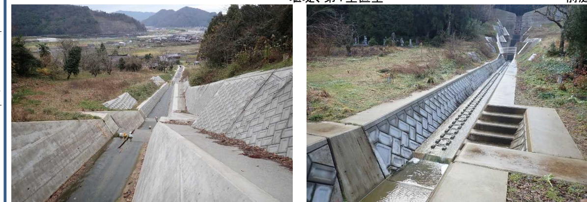
前庭保護工、床固工