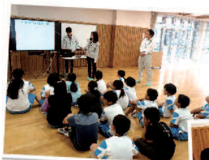
【昨年度の活動実績】 小学校の防災教育 1校 地域の出前説明 2地区