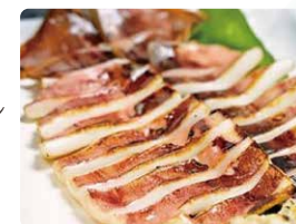
「剣先いかの一夜干し」