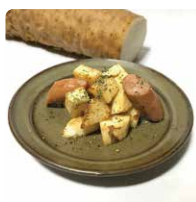
「ねばりっこのジャーマンポテト」 (長芋)