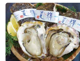
「天然イワガキ「夏輝」」