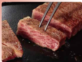
「鳥取和牛ステーキ」