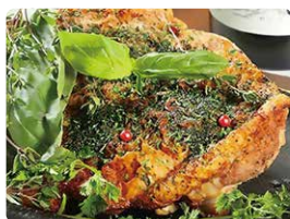
「骨付鶏もも肉のスパイスシーロースト」