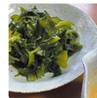
「生ワカメしゃぶしゃぶ」