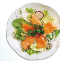
「境港サーモンのカルパッチョ」