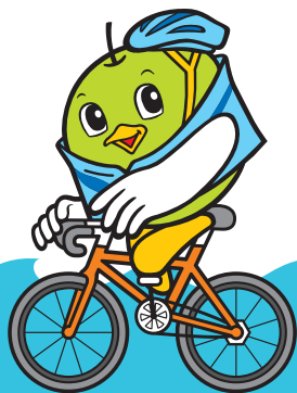
サイクリングトリピー