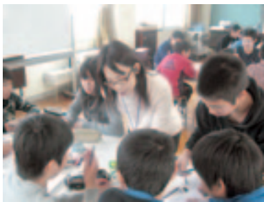
授業中の支援（声かけ）