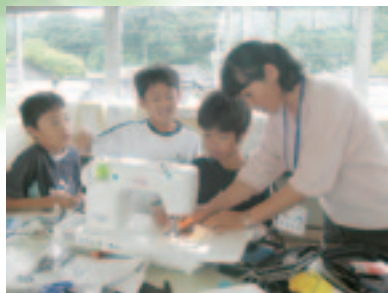
家庭科の指導支援