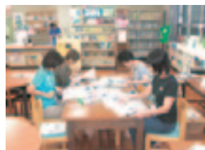
図書の整理・修理