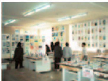
文化祭準備や受付