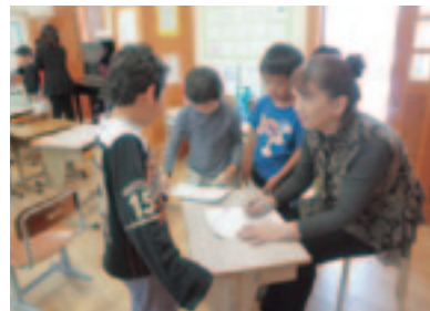
かけ算九九の聞き取り