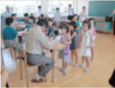
詩の暗唱の聞き取り

教室内で学習支援ボランティアが子どもたちの支援をすることによって学級担任が、学級全体の生活・学習指導に力を注げるようになり、子どもたちが落ちつき、学力の向上につながります。