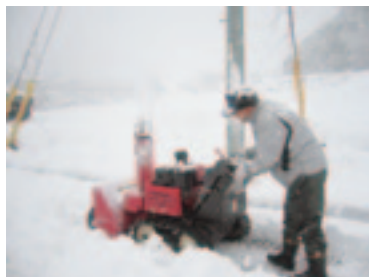
除雪ボランティア