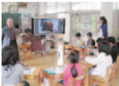
ゲストティーチャーとして