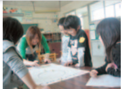
算数のゲームを取り入れた活動