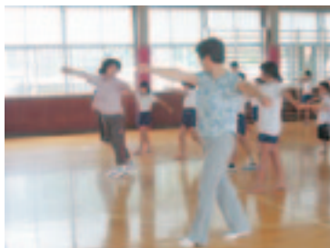
運動会の踊りの指導