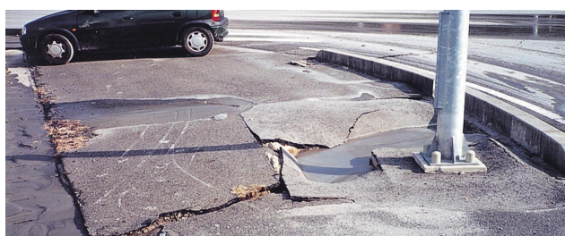
液状化で壊れた道路

インターネットでも 視聴できます！ 防災意識向上のためにも 是非、ご家族等 ご覧ください！