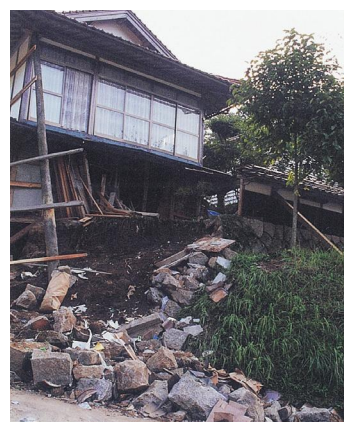
地震で壊れた家屋