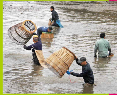
南部町浅井地区 無形民俗文化財 「ため池における魚伏籠(ウグイ)漁」