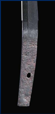
〔太刀 銘 安綱〕 大神山神社蔵 米子市美術館寄託 (米子市指定有形文化財)