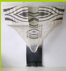
タペストリー 「masquerade」 2005 新匠工芸会展 友賞受賞