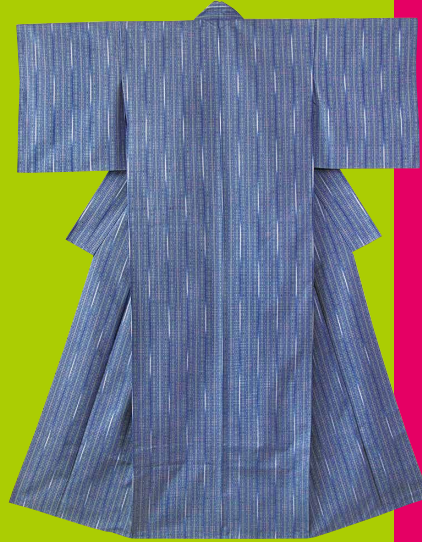
風通織着物 (県無形文化財「染織」保持者・ 吉田公之介氏作)