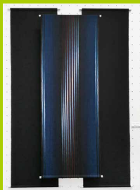
タペストリー 「a streak of light」 2017 新匠工芸会展 富本賞受賞