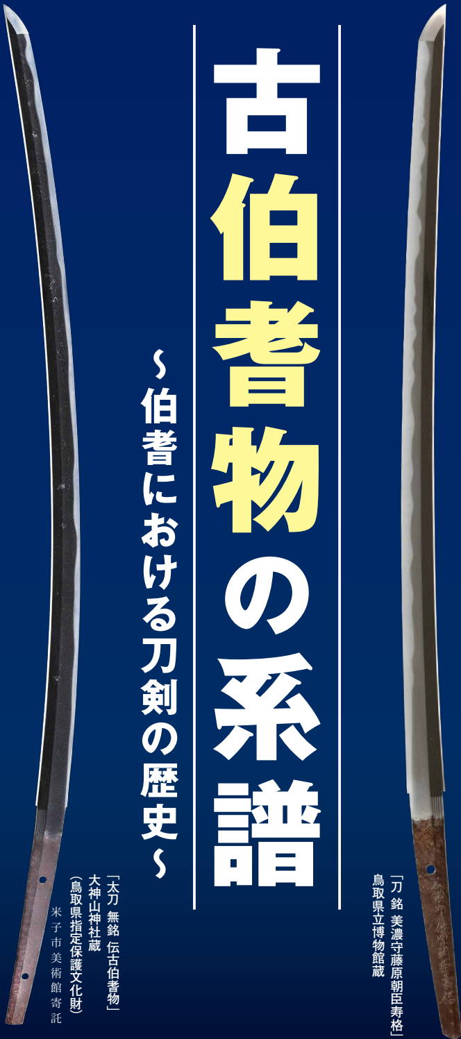
「刀銘美濃守藤原朝臣寿格」 鳥取県立博物館蔵