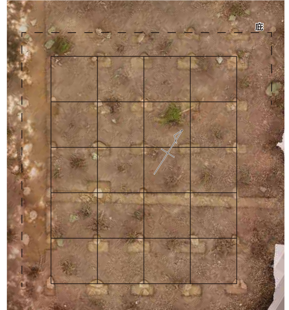
写真2 真上から礎石建物を見た様子