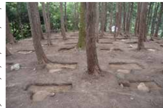
写真6 礎石建物の調査状況

頂部にある北西-南東方向に長い主郭（長軸30m、短軸20m）の奥で、平坦面の幅いっぱいにつくられた3面底（ひさし）を備える大型の礎石建物跡（4間×5間）を確認しました。