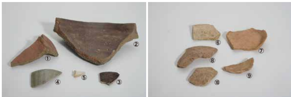
写真7 出土した陶磁器・土器

15世紀後半から16世紀前半までに作られた播鉢（備前焼：①、②）、天目茶碗（古瀬戸：③）、青磁碗（④）・白磁皿（⑤）（中国陶磁）、土師質土器の皿⑥～⑩などが見つっています。