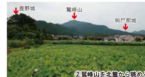
②鷲峰山を北麓から眺める