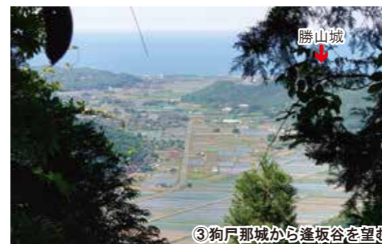
③狗尸那城から逢坂谷を望む