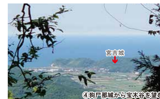
④狗尸那城から宝木谷を望む