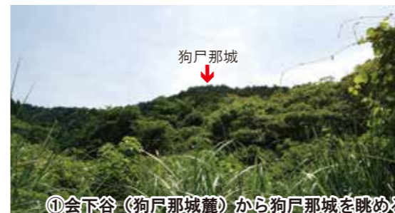
①会下谷（狗尸那城麓）から狗尸那城を眺める

調査に当たってご同意をいただきました地権者様、ご理解とご協力をいただきました地元の皆様に改めてお礼申し上げます。