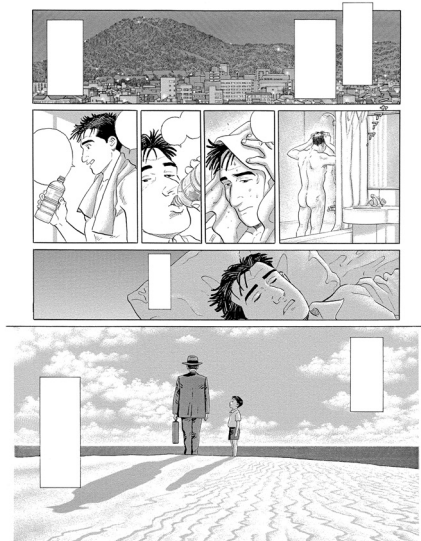
「孤独のグルメ」©パビエ