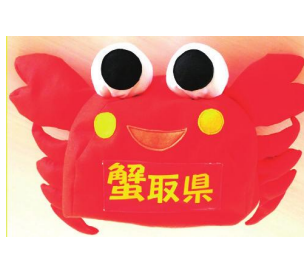
蟹取県オリジナルウェルカニキャップ 5,800円(税込・送料込)