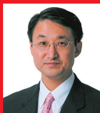
鳥取県知事 平井伸治

冬の味覚の王様「松葉がに」漁が11月6日に解禁され、鳥取県は「蟹取県」になりました! 日本一の鳥取砂丘や中国地方最高峰の大山(だいせん)など大自然に包まれ豊かな大地と雄大な日本海に育まれた「食のみやこ」は、カニの水揚げ量日本一! 美味しく思わず静かニ食べるカニは、「新しい生活様式」にピッタリでは。 現在、蟹取県では、県内宿泊客に抽選で毎月カニが当たる「ウェルカニキャンペーン」を開催中です。 お家でカニを楽しみたい方々には、自慢のカニの逸品をお届けする「ウェブカニキャンペーン」を実施します。 みなさまに美味しく召し上がっていただくことが、コロナで厳しい状況にある漁業者の応援になります。 鳥取県は旬のおいしいものを「取っとり」ます。苦しい時のカニ頼み。みんなカニばれ!