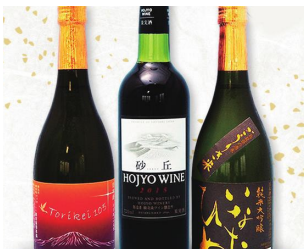
鳥取県産 地酒・地ワインセット 8,888円(税込・送料込)