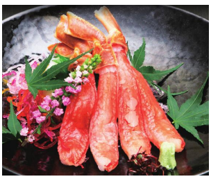
生ズワイ棒ポーション(25本×2袋) 8,000円(税込・送料込)