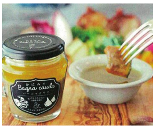
かにみそバーニャカウダーセット 3,300円(税込・送料別)