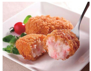
山陰ごほうびかににクリームコロッケ 3,000円(税込・送料込)