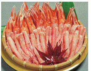
境港 紅ずわい銅セット 6,480円(税込・送料込)