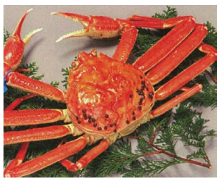
境港産 松葉かに 12,420円(税込・送料込)