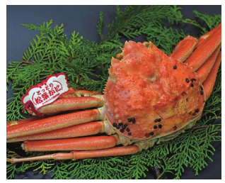
松葉かに(特々大・ポイル) 20,000円(税込・送料込) ※時期により価格が変動します