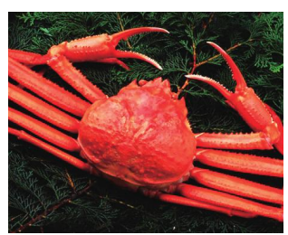
紅ズワイガニ(ポイル) 3枚入り 4,500円~(税込・送料込)