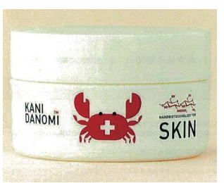
スキんケアジェル モイスチャージェル 7,150円(税込・送料別)