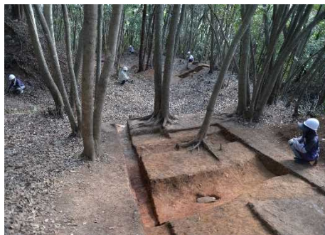
古代山陰道の調査