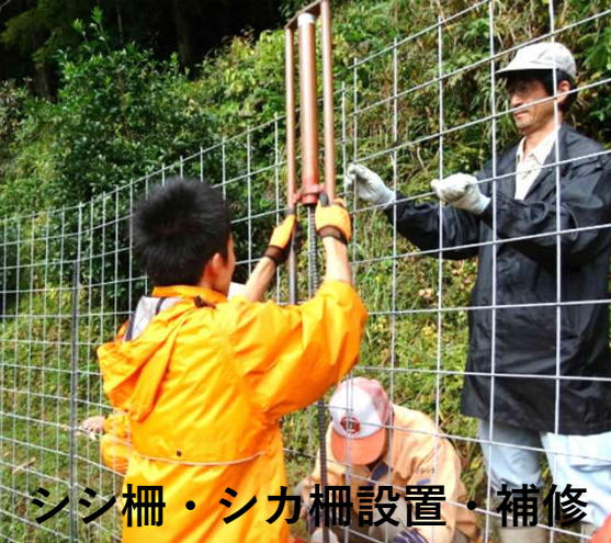
シン柵・シカ柵設置・補修