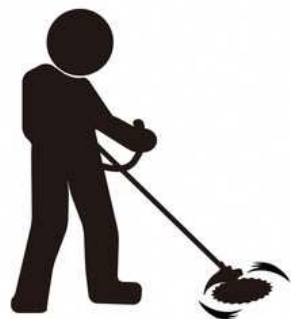
畦畔や農道の草刈り