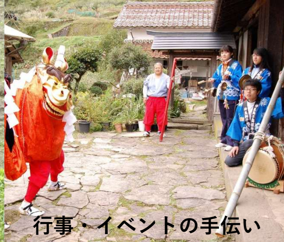
行事・イベントの手伝い