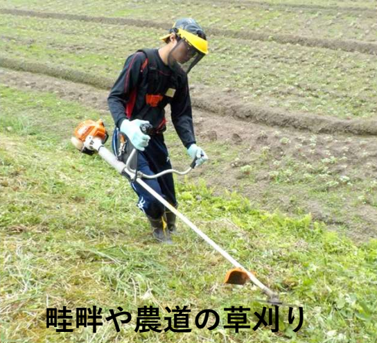
畦畔や農道の草刈り