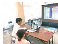
オンライン説明会