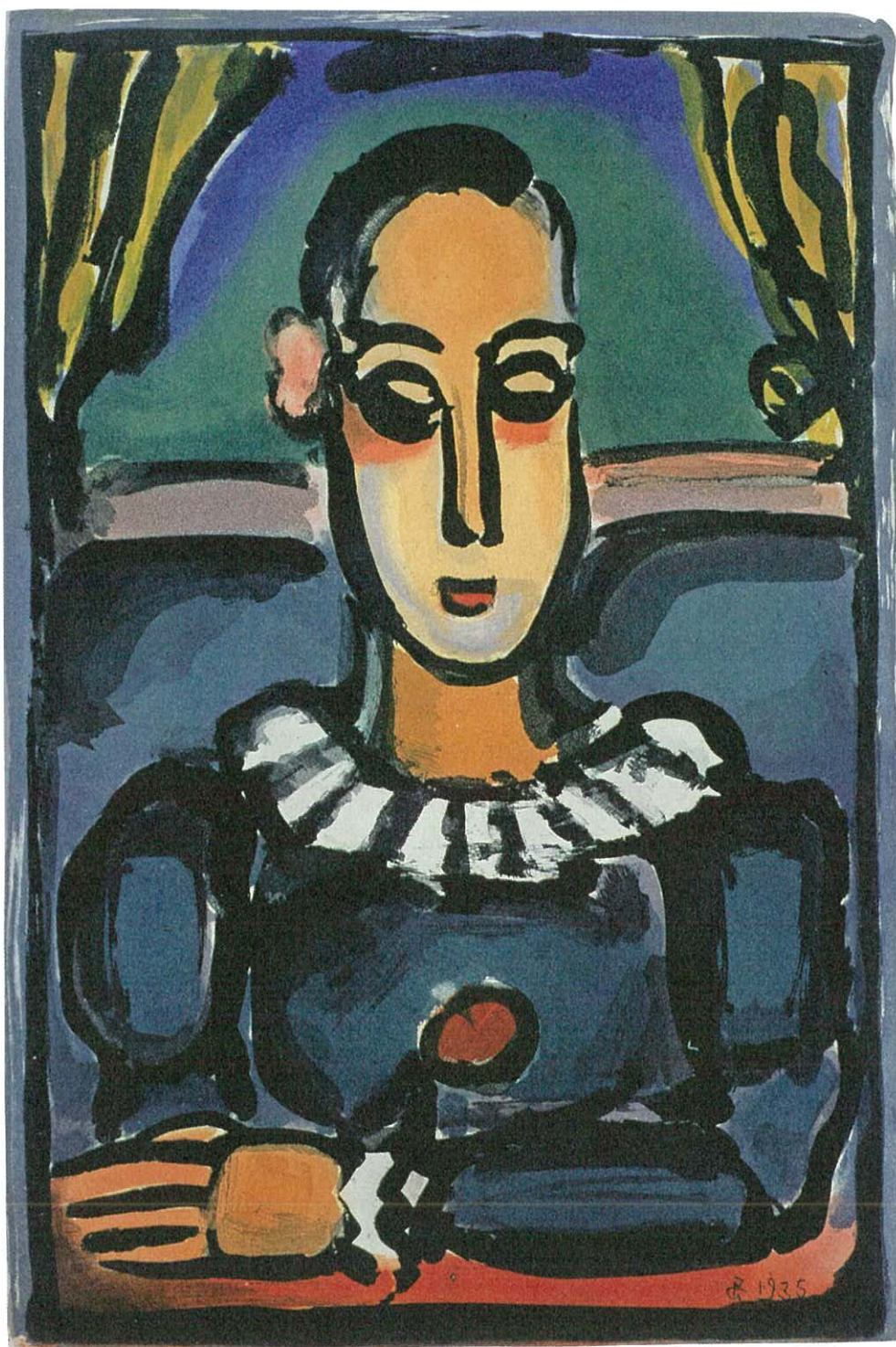
ジョルジュ・ルオー 《『流れる星のサーカス』より「II - 黒いピエロ」》1935年、アクアティント・紙、鳥取県立博物館蔵 ©ADAGP, Paris & JASPAR, Tokyo, 2021 G2426

近現代版画の魅力 — ルオー、クラウヴエ、菅井汲、深澤幸雄、李禹煥らを中心に —