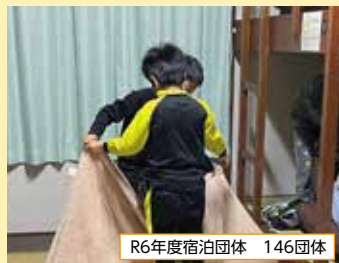
R6年度宿泊団体 146団体