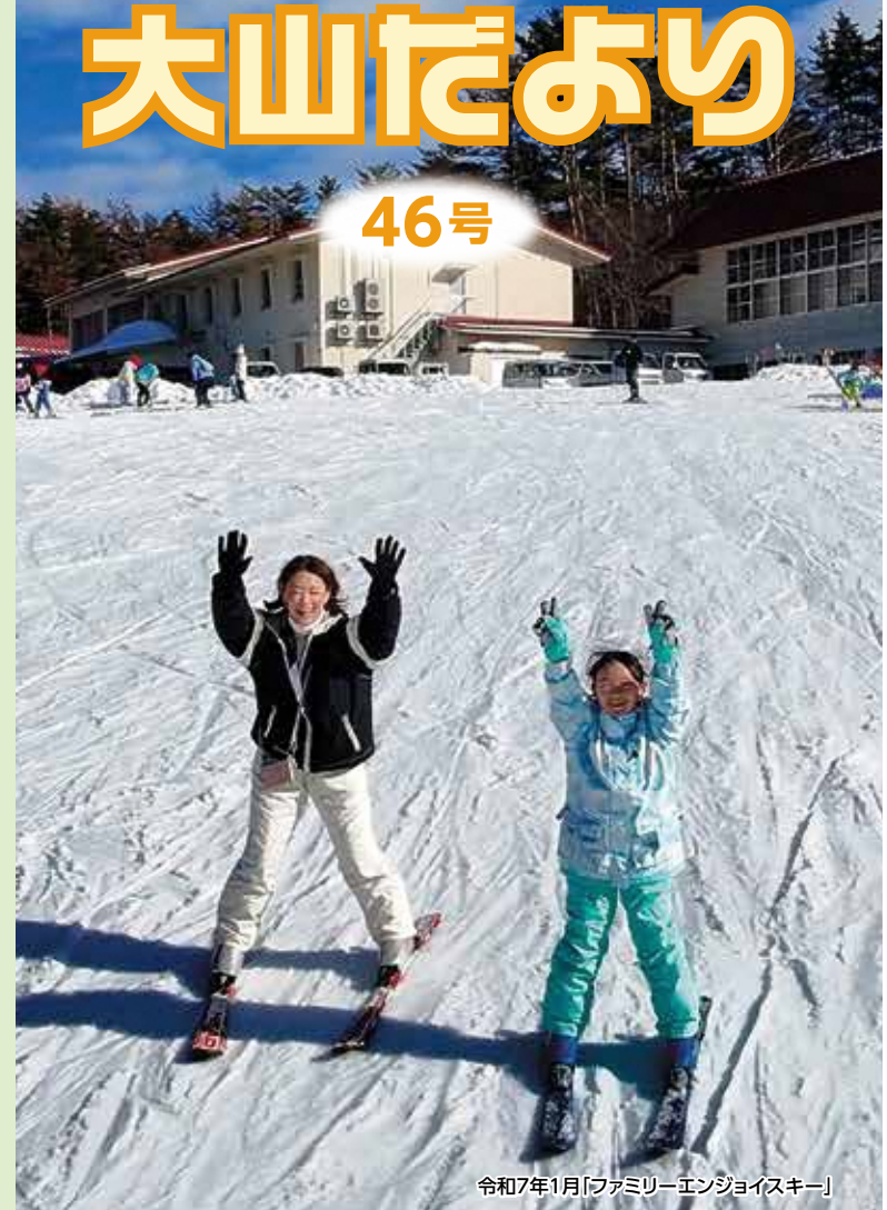
令和7年1月「ファミリーエンジョイスキー」