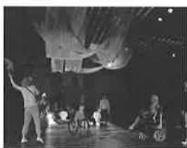
演劇公演「ゆかいアート村 はじまり物語」 7.10(土)・11(日)三股町立文化会館

詳細やその他のイベントについては「国文祭・芸文祭みやざき2020」大会ホームページをご覧ください。