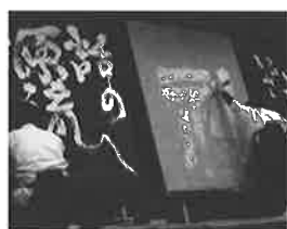
「こころ」のふれあうフェスタ2020 8.7(土)メディキット県民文化センター