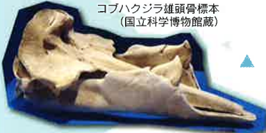
コバクジラ雌頭骨標本 (国立科学博物館蔵)