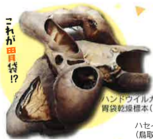
ハンドウイルカ 胃袋乾燥標本 (国立科学博物館蔵)