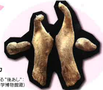
マッコウクジラに残る“後あし”：寛骨・大腿骨標本 (国立科学博物館蔵)