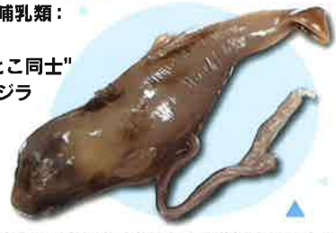
コマッコウ胎児浸液標本 (鳥取県立博物館蔵)