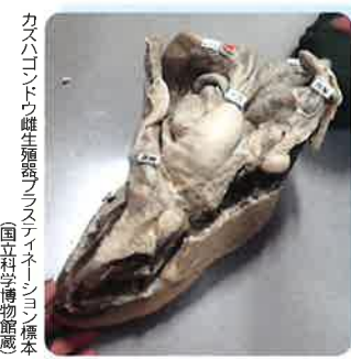
カスハゴンドウ雌生歯型(メステイノシオン)標本 (国立科学博物館蔵)