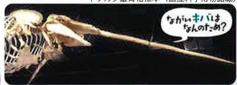
イツカク雄骨格標本 (国立科学博物館蔵)