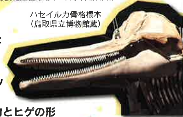
ハセイルカ骨格標本 (鳥取県立博物館蔵)