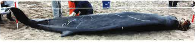
境港市に漂着したオウギハクジラ

次回展覧会は ととりの乱世 —因幡・伯耆からみた戦国時代— 10/9(土)～11/7(日)