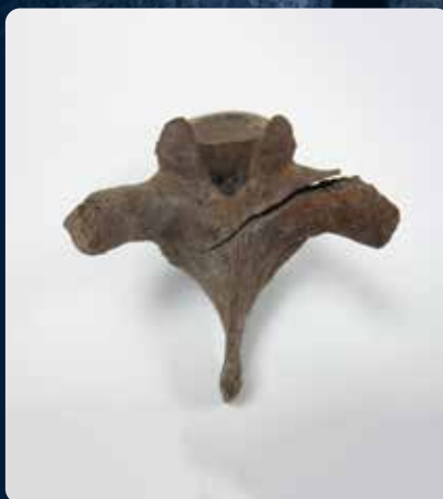
鋭利な刃物で傷付けられた痕跡がある背骨