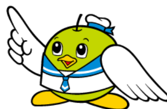
鳥取県マスコットキャラクター トリピー