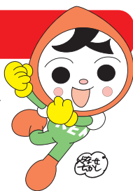
UJAF 人権イメージキャラクター 人KENまもる君