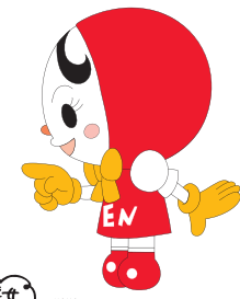
UJAF 人権イメージキャラクター 人KENあゆみちゃん