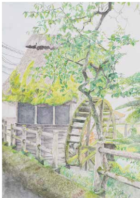
坂本 奈優 (中3・琴浦町)