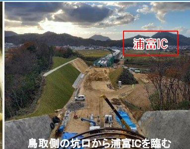
鳥取側の坑口から浦富ICを臨む