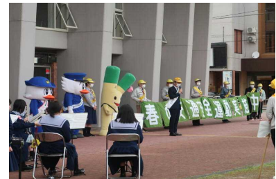
前年の運動重点に沿った主な取組状況