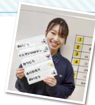
ニックネーム なっちゃん

私は、香川県の出身で去年から鳥取県で生活をしています。慣れない土地で不安もありましたが、学級の生徒と一緒に働く先生方にたくさん助けをもらい、毎日楽しく働くことができています。鳥取県で生活をしてみて、一番に感じることは人の温かさです。特に周りの先生方は、右も左もわからない私に、「いつでも相談にのるからね!」と声をかけてくださいました。私は、自然が豊かで食べ物もおいしく、地元の人も温かい鳥取県に来ることができて本当に良かったと思っています。みなさんも魅力いっぱいの鳥取県と一緒に働きませんか?