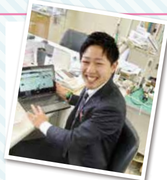
ニックネーム ヨネ