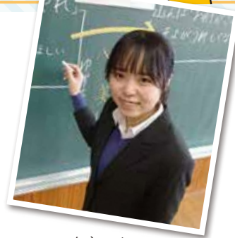
ニックネーム ひよこ