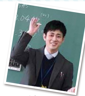
ニックネーム y y u

鳥取県で働いたら、すぐに自然と人の虜になるでしょう。もしも、あなたが学級経営や教科指導で悩むとき、きっと周りの人達が優しく声をかけてくれるでしょう。一緒に働くことができる日を楽しみにしています。