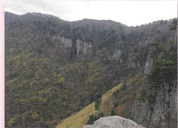
秋の船上山 (屏風岩)