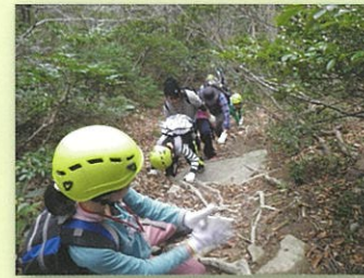
険しい健脚コース

【東坂コース】(2~3時間) 最も緩やかなコースで、後醍醐天皇が下山に使われた道です。 【西坂コース】(4~5時間) 後醍醐天皇が登頂された道で、直接船上山神社に到着できます。 【正面コース】(3~4時間) 屏風岩の間の険しい健脚コースを登る道で、一直線に頂上をめざします。 【滝のぼりコース】(4~5時間) 雄滝・雌滝の雄大な滝の真下を巡りながら、最後は険しい健脚コースを登ります。