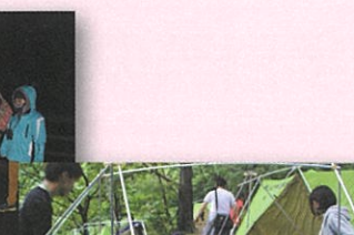
みんなで協力してテント設営

テントサイトには、20張以上のテントが設営でき、大自然の中でのんびりとした生活を楽しむことができます。また、野外炊飯場 (屋根付き2棟、200人収容) や水洗トイレが隣接しています。