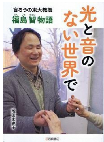
福島智（1962.12～） 盲ろう者で大学教授に なった日本最初の人