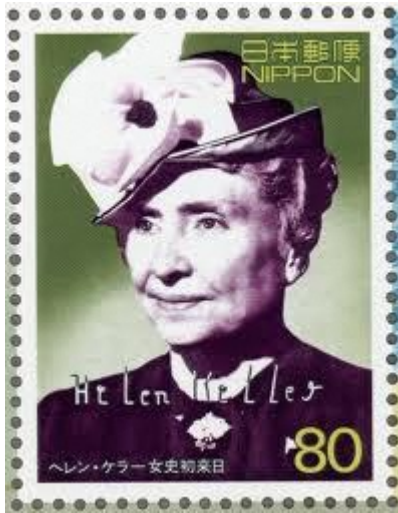
ヘレン・ケラー（1880.6～1968.6） 盲ろう者で大学教育を 修めた世界最初の人