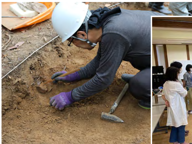
フィールドワーク「発掘調査」