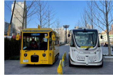
他交通との乗り継ぎ