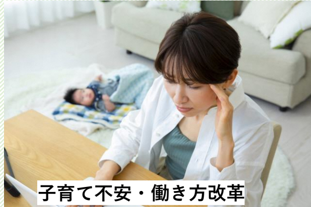
子育て不安・働き方改革