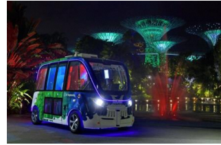
プロジェクション マッピング