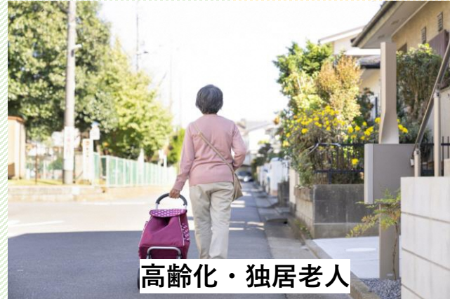
高齢化・独居老人