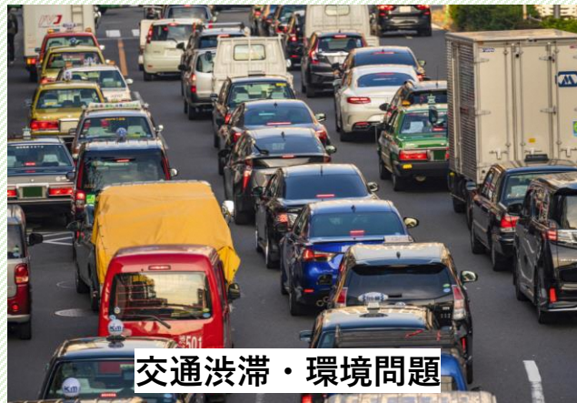
交通渋滞・環境問題