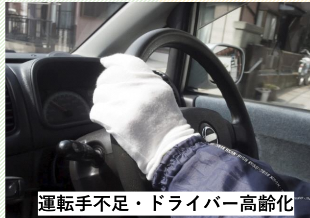
運転手不足・ドライバー高齢化