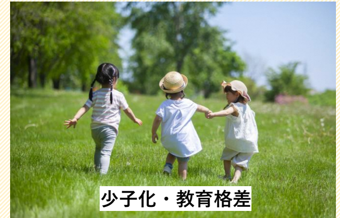
少子化・教育格差