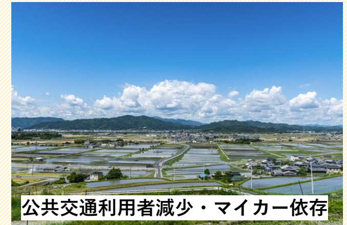
公共交通利用者減少・マイカー依存

このまま何もしなければ運転手不足が続き 地方路線は減便いずれ廃線をせざるを得ない状況