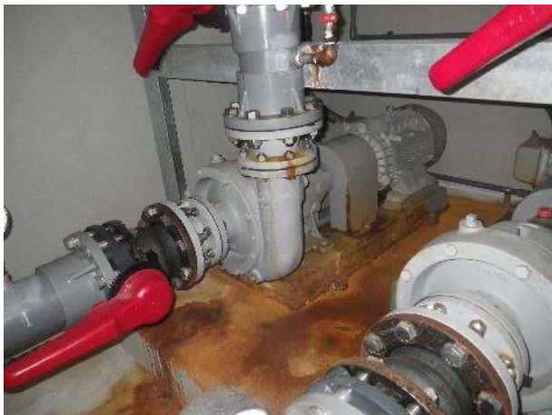
井戸海水揚水ポンプ（4-1号）状況