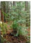
コウヨウザン スギの約2倍の成長量。 切り株から萌芽更新。