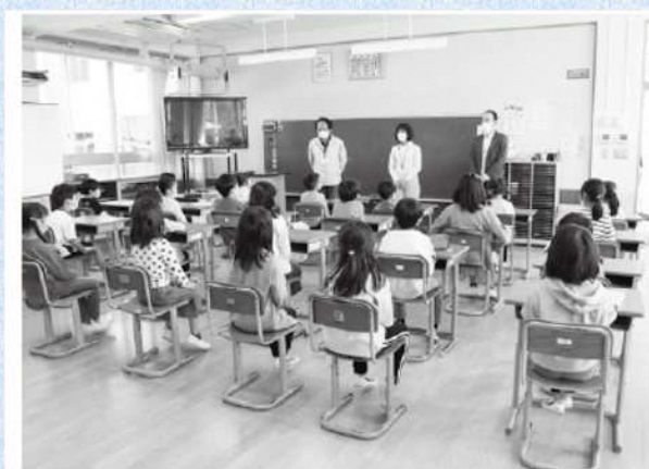
開所式での指導員挨拶の様子