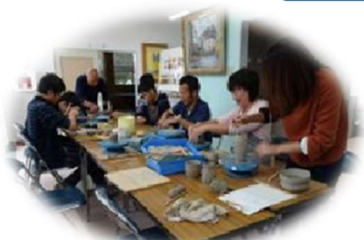
陶芸活動「手びねり」