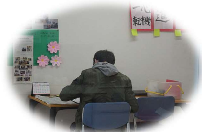
目標に向かって学習