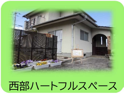
西部ハートフルスペース