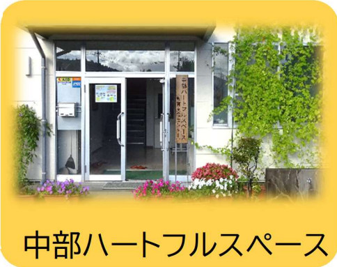
中部ハートフルスペース