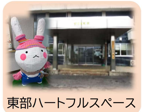
東部ハートフルスペース