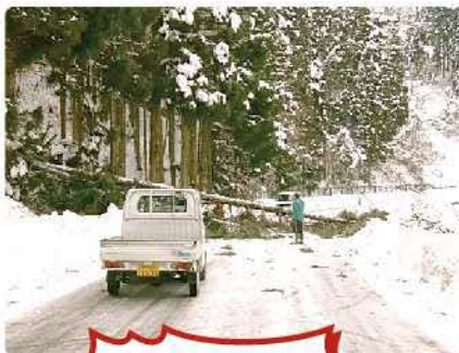
倒木で道路が通行止