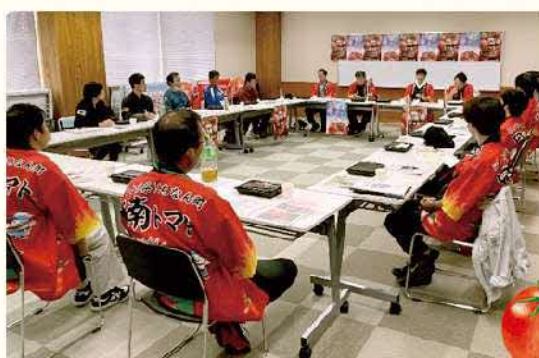
▲意見交換会の様子

た。当日は、日南町内外合わせて 5名の参加者があり、特に意見交 換会では参加者と生産者との間 で活発な質疑応答が行われ大変 盛り上がり、参加者からも大変好 評でした。