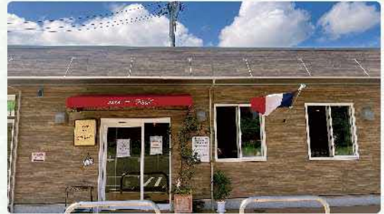
▲青空の下、今日も満席です！

県外の知人が江府町に来て、「とても良いところだね」と言うのを聞くにつけ、「そのとおり。でも日野郡のよさは、残念ながらあまり知られていない。うちの店だけが賑わうのではなく、江府町、そして日野郡を訪問するきっかけをつくることで地域全体の盛り上げに貢献していきたい」…そんな思いをもって日野高校とのコラボや、地元の新商品を使った新たなメニューも現在考案中です。