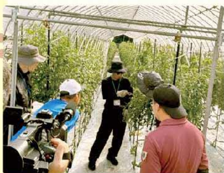
▲収穫のポイントを説明する生産者

今回は「トマトの収穫」と「トマ ト選果場見学」、「参加者と若手 生産者との意見交換」を行いまし