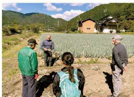
▲第2回日野郡就農セミナー(現地白ネギ圃場見学)の様子

*「日野郡営農モデル」：日野農業改良普及所が作成し、就農者タイプ(新規就農・集落営農法人・退職者就農・年 金受給ゆとりタイプ)ごとに日野郡でトマト・ピーマン・白ネギを栽培した場合に必要な初期投資内容、時期別 の1日当たり労働時間、所得目標等を試算した営農計画。日野郡内の就農相談に活用している。