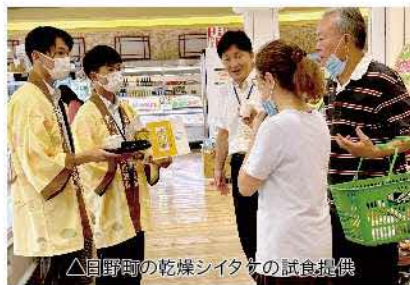
▲日野郡の乾燥シタマの試食提供