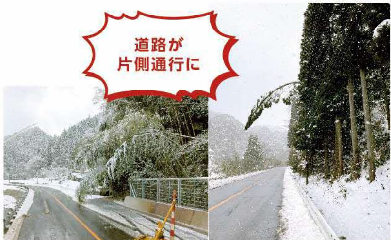
道路が片側通行に

なお、風雨や積雪等により建築限界を侵すなど道路交通への危険が迫った時は、 道路の交通安全確保のためやむを得ず緊急措置として、道路管理者において剪定又は伐採を行う場合があります ので、ご理解をよろしくお願いします。