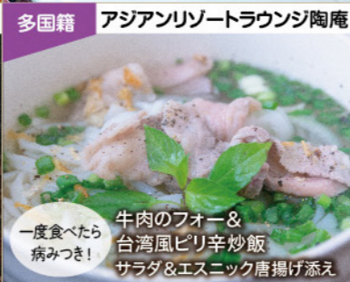
多国籍 アジアンリゾートラウンジ陶庵 一度食べたら病みつき! 牛肉のフォー&台湾風ピリ辛炒飯 サラダ&エスニック唐揚げ添え