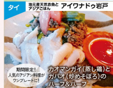
タイ レストラン パロンジャヤ カオマンガイ(蒸し鶏)とガバオ(炒めそば)のハーフ&ハーフ