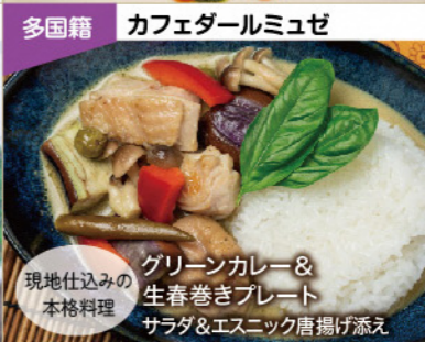
多国籍 カフェダールミュゼ 現地仕込みの本格料理 グリーンカレー&生春巻きプレート サラダ&エスニック唐揚げ添え