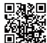
鳥取県「やさしい日本語」サイト