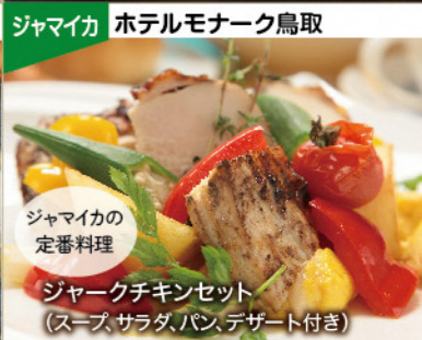
ジャマイカ ホテルモナーク鳥取 ジャマイカの定番料理 ジャークチキンセット(スープ、サラダ、パン、デザート付き)