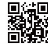
台中市観光PR動画 Taichung, The Heart of Taiwan 日本語ナレーション ビビアン・スー