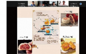
2022年9月 吉林外国語大学(28名)と公立鳥取環境大学(7名)と鳥取大学(6名)の41名によるオンライン交流

中国吉林省とは1994年に友好交流覚書を締結し、経済、教育、文化等の分野で交流を行っています。自動車産業等が発展していますが、豊かな自然にも恵まれています。学生による交流も活発に行われています。