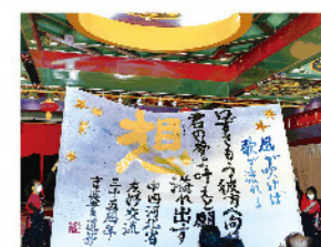
河北省友好35周年事業 2021年11月 鳥取中央育英高校書道部による書道パフォーマンス

河北省とは1986年に友好関係提携を締結し、昨年度は35周年を記念してWEB書道作品展を開催しました。河北省廊坊市には、2019年に世界最大規模を誇る北京大興国際空港が開港し、同省の「雄安新区」では「深セン経済特区」、「上海浦东新区」に次ぐ国家級の開発プロジェクトが進められるなど、今後の経済発展が期待されています。2022年の冬季オリンピックでは張家口市でスノーボード等の競技が行われました。