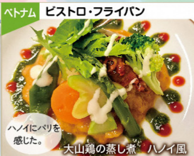
ベトナム レストラン フライパン ハニイにパリを感じた。 大山鶏の蒸し煮 ハニイ風