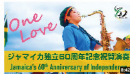
ジャマイカ 独立60周年記念祝賀演奏

鳥取県は2016年にジャマイカ・ウェストモアランド県と姉妹提携を締結しました。以降、鳥取県とウェストモアランド県は、青少年交流・マラソン交流・職員派遣・技術交流などを実施しています。9月2日に東京都内で開催されたジャマイカ独立60周年記念式典で、岩美高校吹奏楽部の演奏動画が披露され、国内外の来賓から大きな拍手が寄せられました。