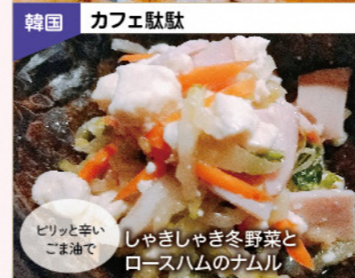
韓国 カフェ駄駄 ピリッと辛いごま油で しゃきしゃき冬野菜とロースハムのナムル