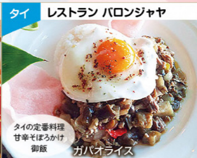
タイの定番料理 甘辛そばかけ御飯 ガバオライス