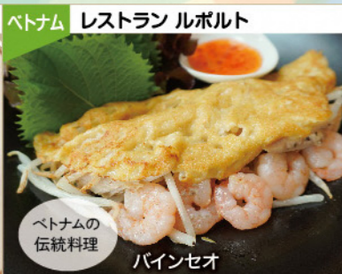
ベトナム レストラン ルポルト ベトナムの伝統料理 バインセオ