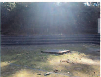
⑨キャンプファイヤーサイト