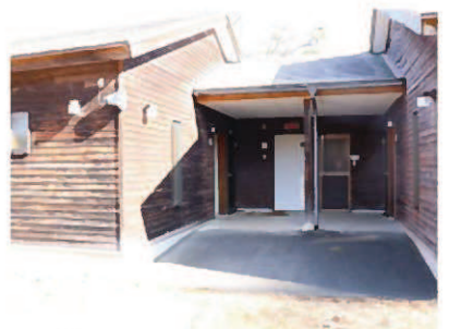
⑤トイレ・シャワー室