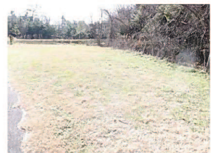
⑪キャンプ利用者駐車場