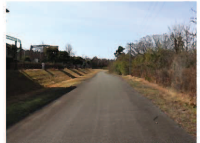
②キャンプ場への車両進入路