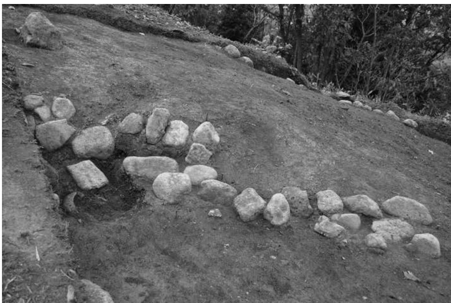
1 北東側突出部 南辺貼石検出状況(9T) 南東から