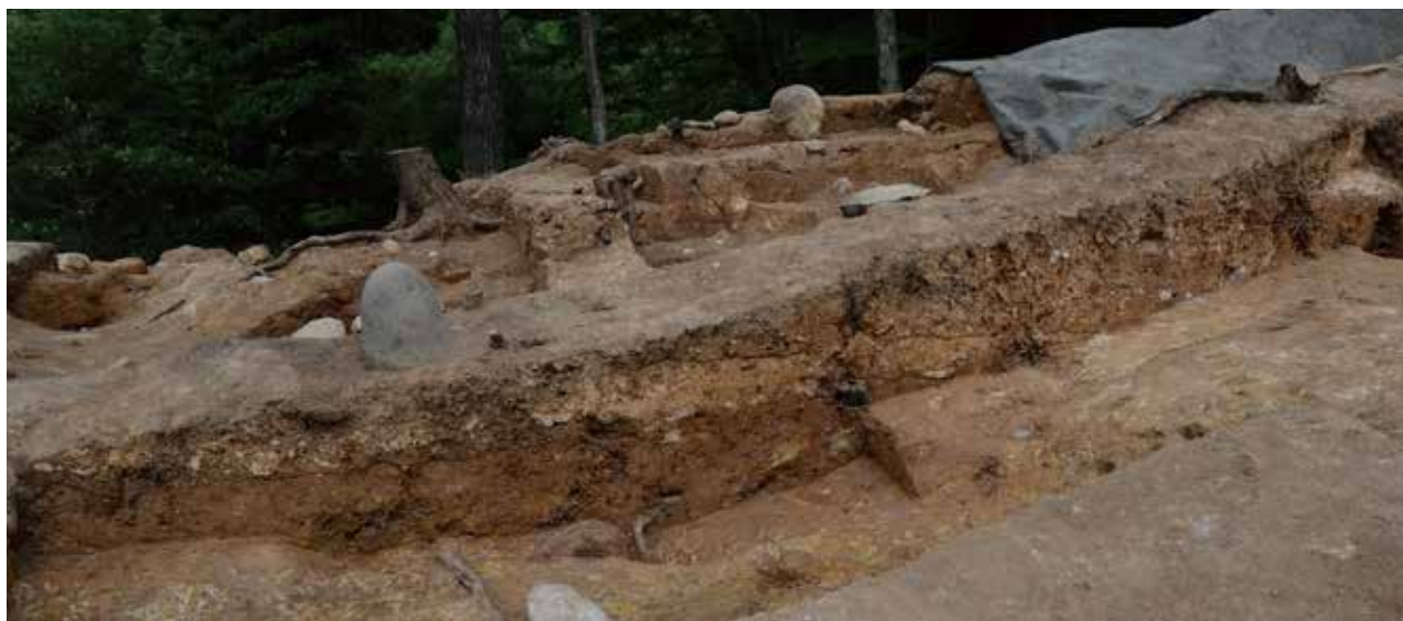
1 墳丘盛土及び埋葬施設墓壇埋土 Z-Z'ライン 南西から