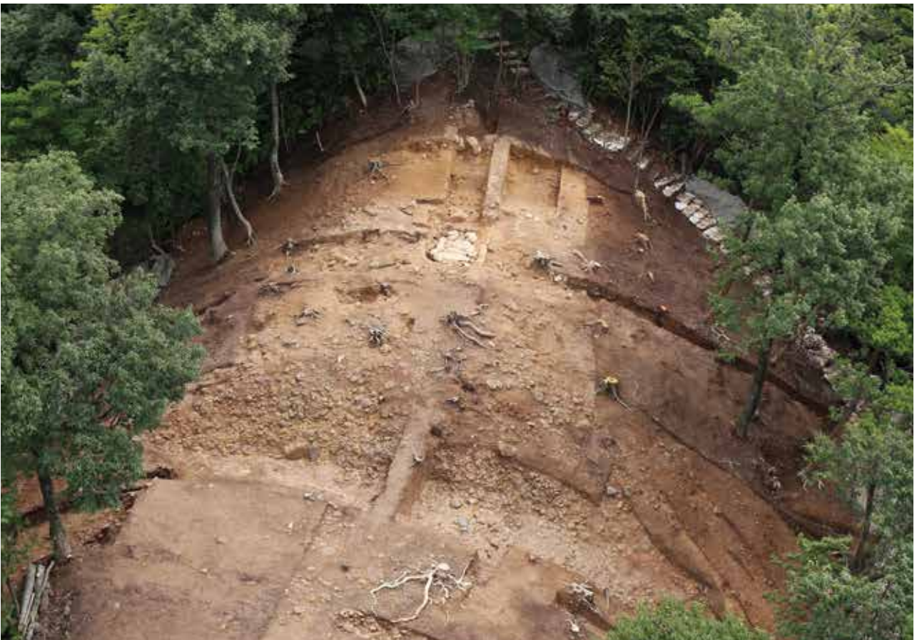
2 仙谷8号墓 調査終了状況 北西から