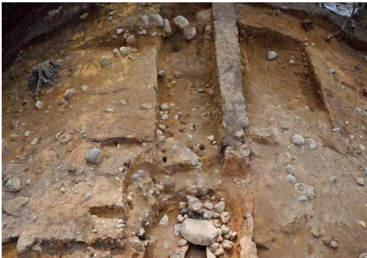
1 南側区画溝 調査終了状況 北西から