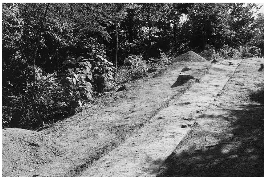
3 C地点調査終了状況 北東から