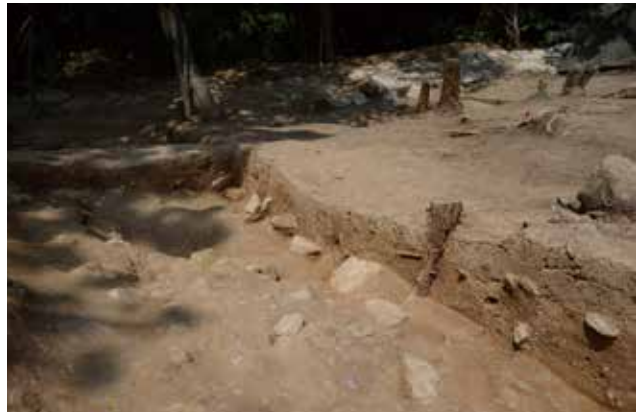
3 北側区画溝 L-L'ライン標高75~74m付近 南東から