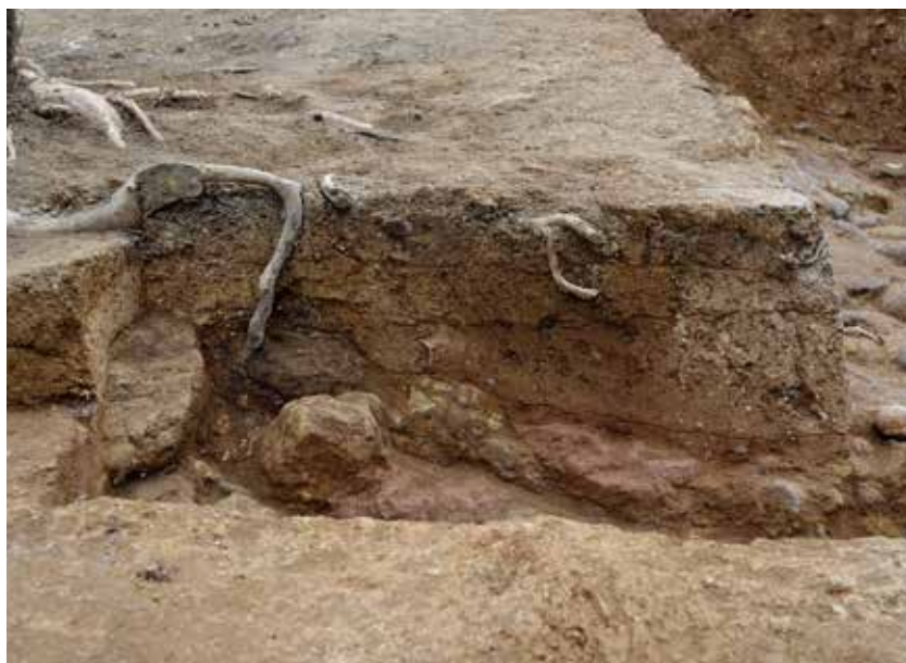
1 北側区画溝 M'-N ライン 南西から