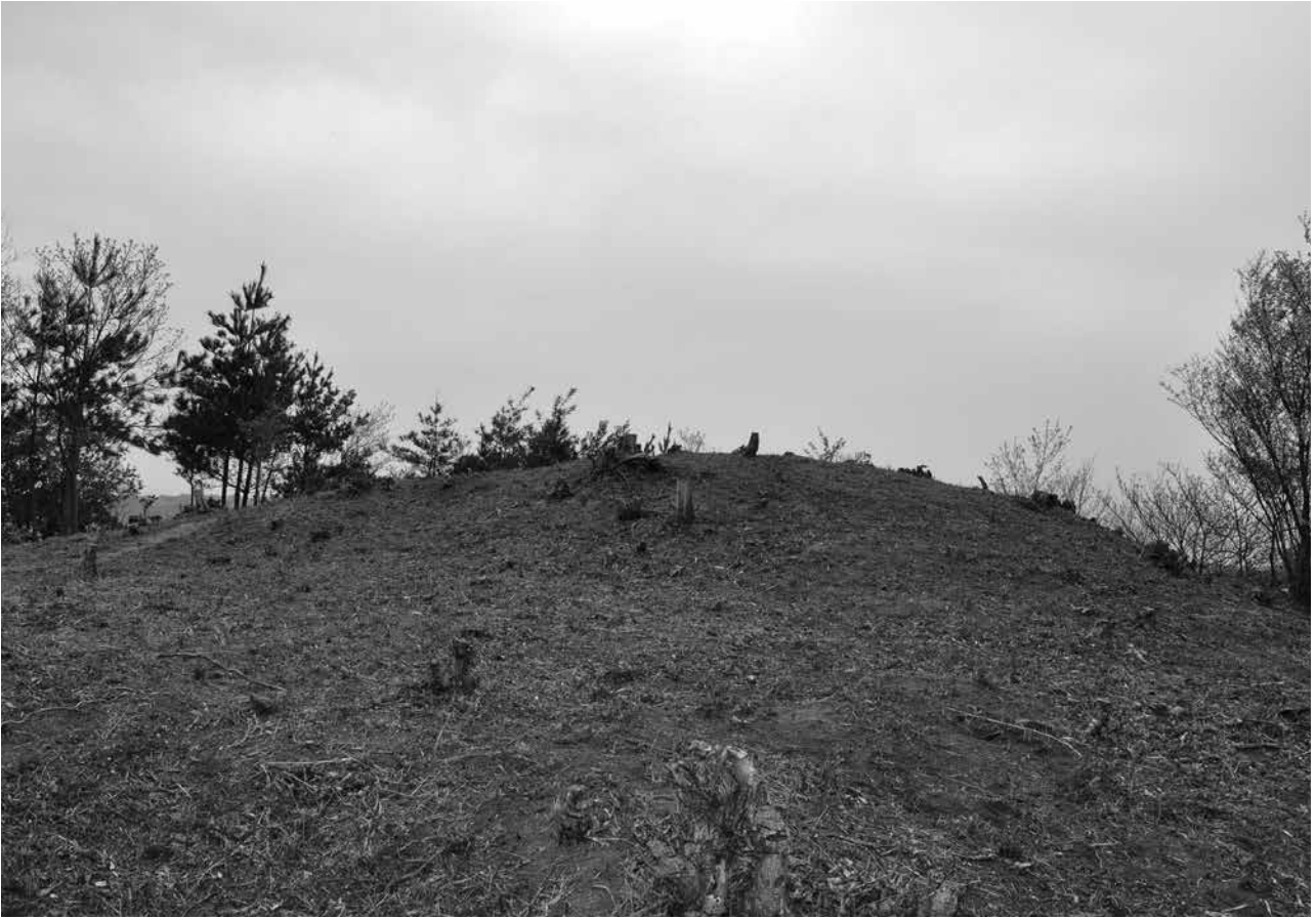
1 調査前 南東から