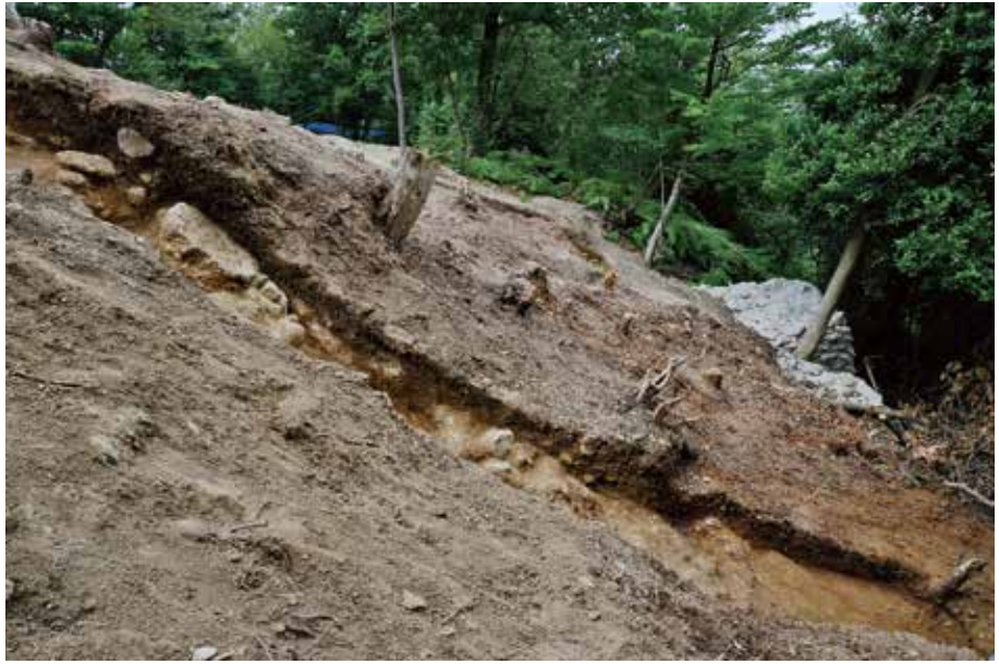
1 H-H'ライン 南東から