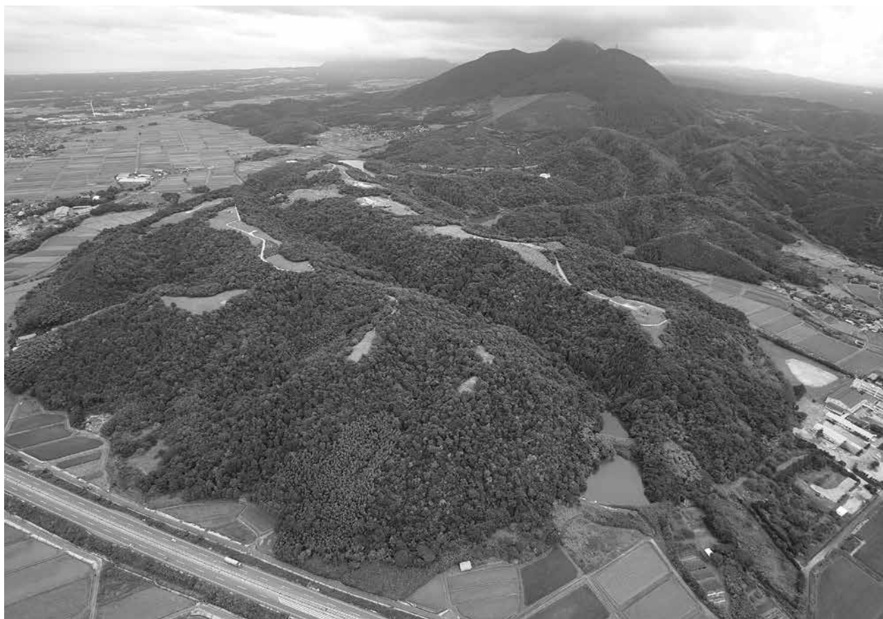
1 妻木晩田遺跡全景 北西から