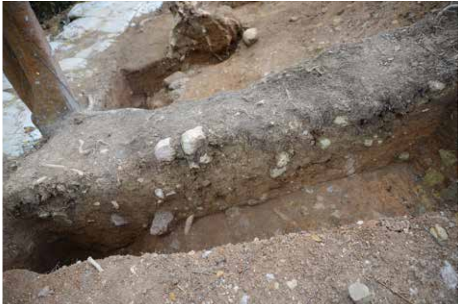
2 J-J'ライン 南東から