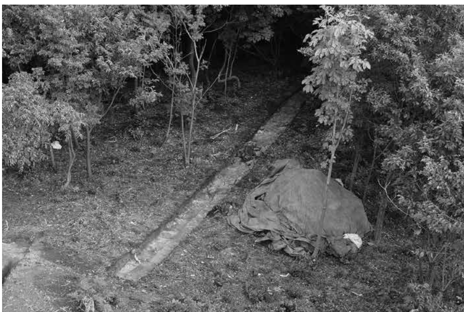
3 仙谷 1 号墓東側 12T 調査終了状況 南西から