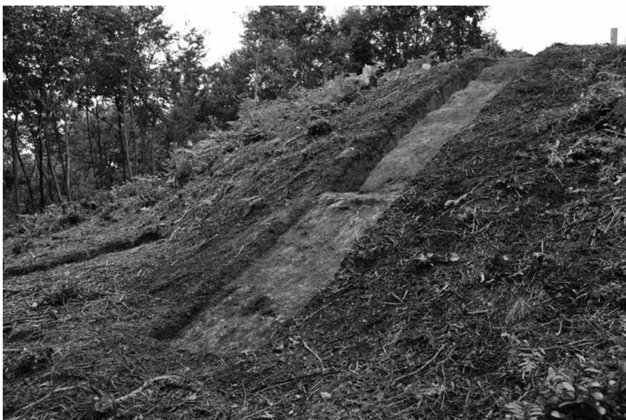
2 仙谷 1 号墓東側 11T 調査終了状況 北東から