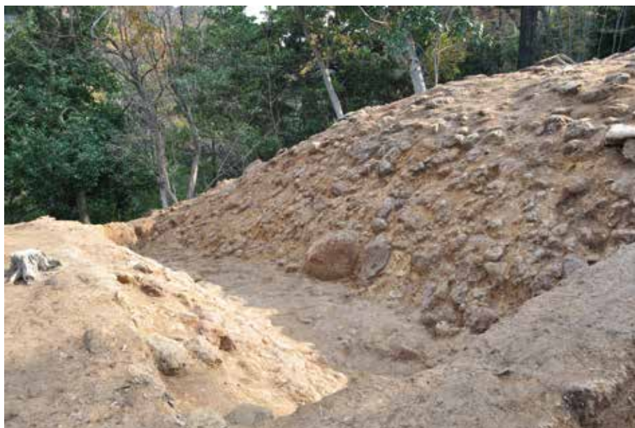
1 北側区画溝 東側調査終了状況 西から