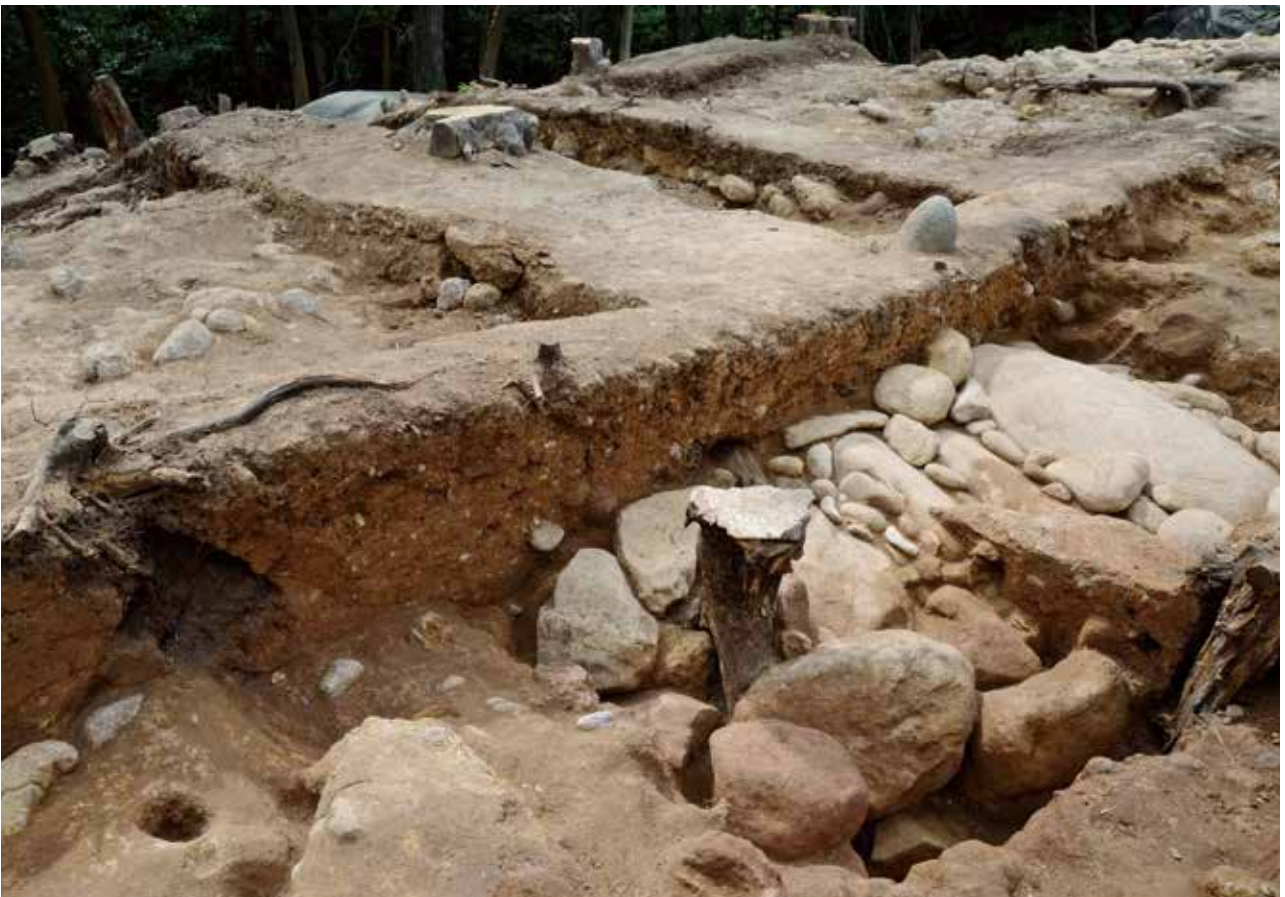
2 墓壙埋土 Y-Y'ライン 東から