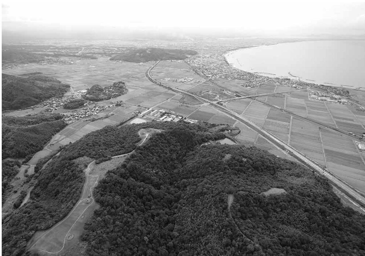
2 仙谷地区・洞ノ原地区 墳丘墓群の立地 東から