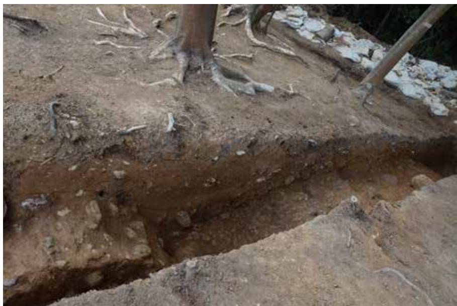
2 H'-Hライン 標高78～76m付近 北から