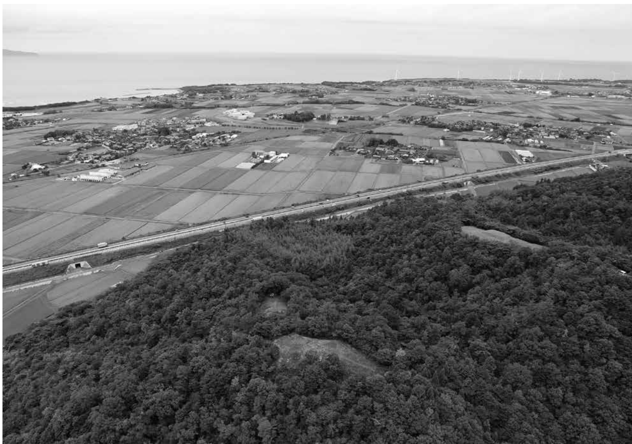
1 仙谷墳丘墓群全景 南西から