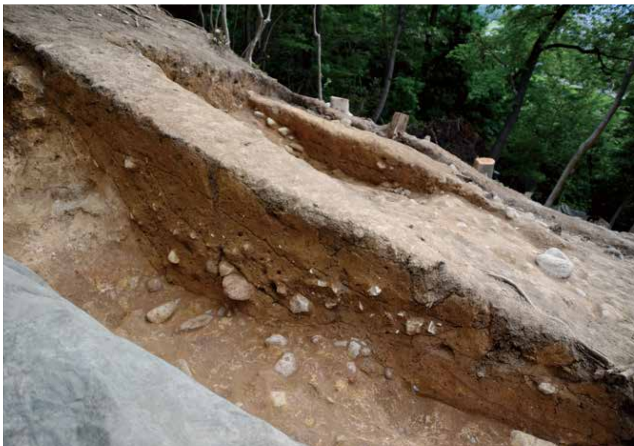
2 南側区画溝及び墳丘盛土 Y-Y' ライン 北東から