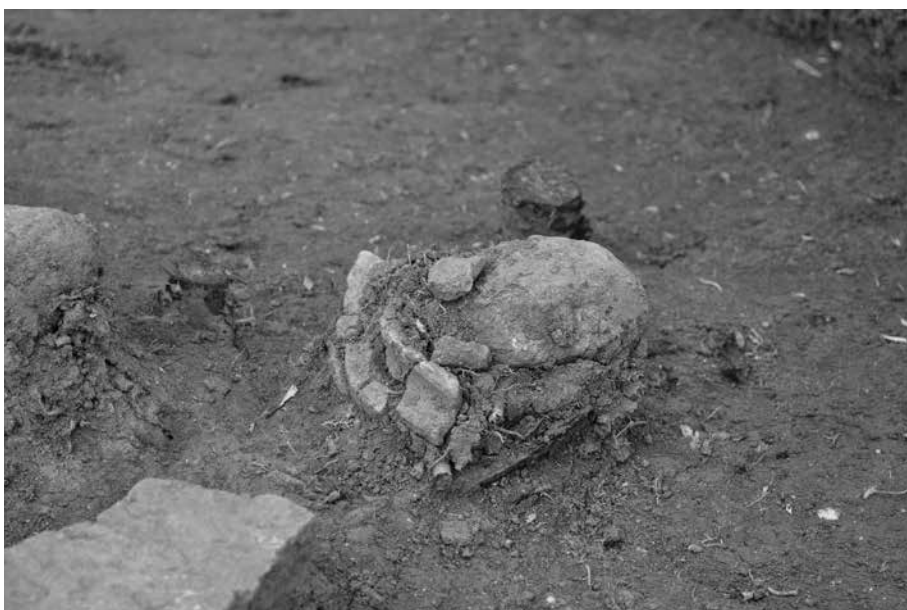
3 北東側突出部 甕(6)出土状況(9T) 南から