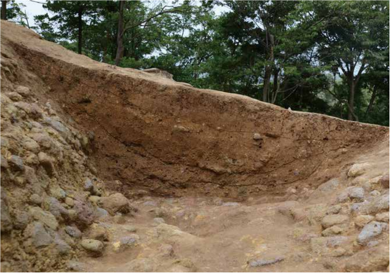
1 北側区画溝 X-X'ライン 東から