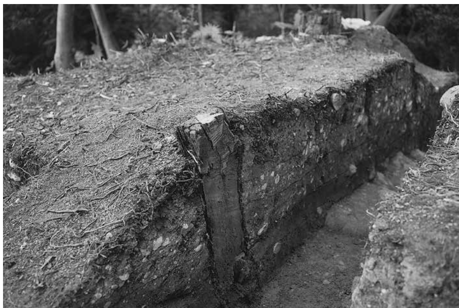
1 B地点S6東トレンチ 断面 南西から