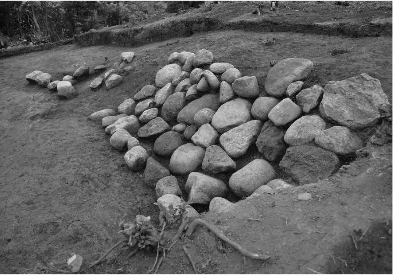
1 南西側墳裾 貼石検出状況 (3T・4T) 南東から