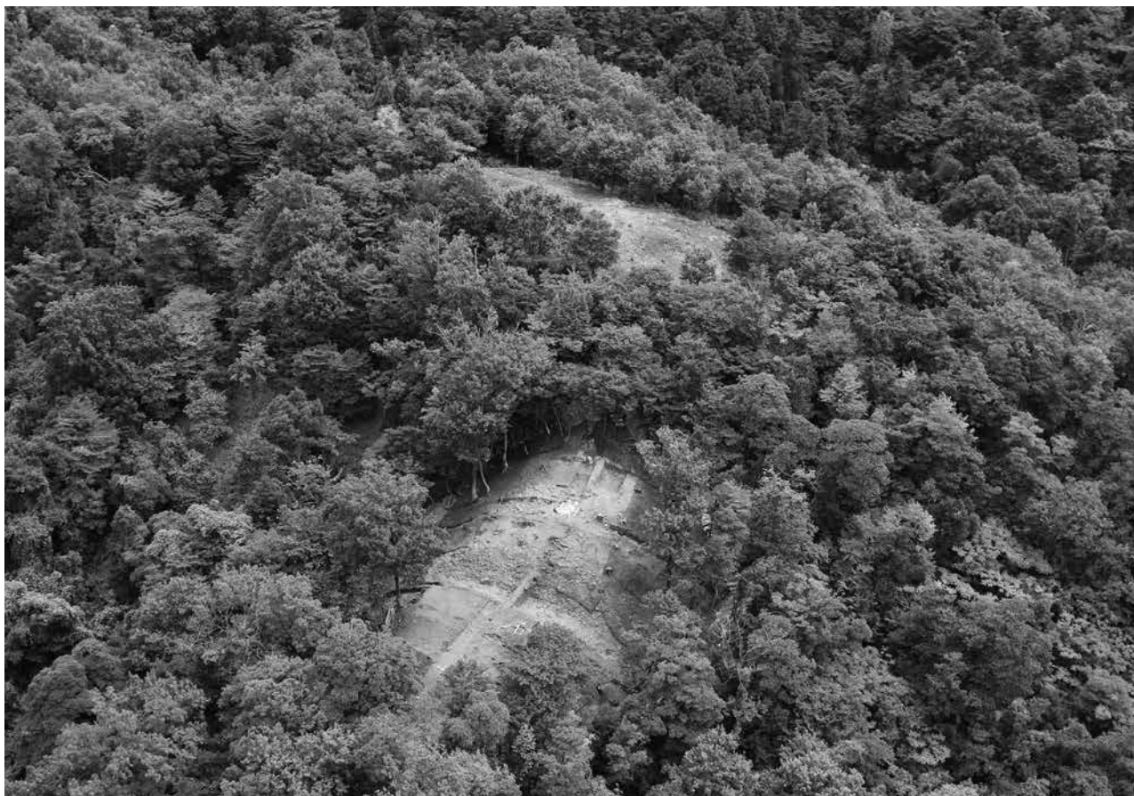
2 仙谷1号墓・8号墓・9号墓 北西から (写真上から1・8・9号墓)