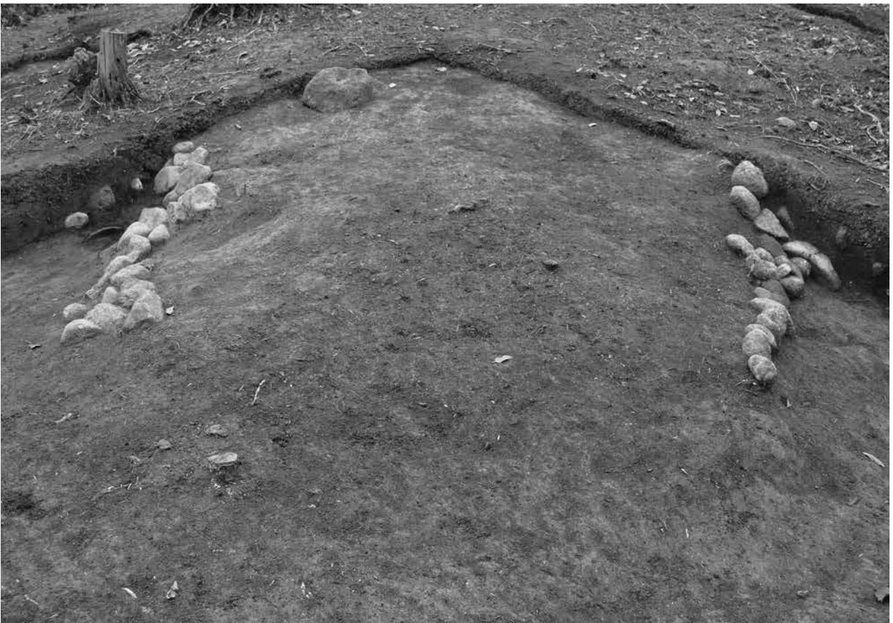
2 北東側突出部検出状況 (9T) 北東から