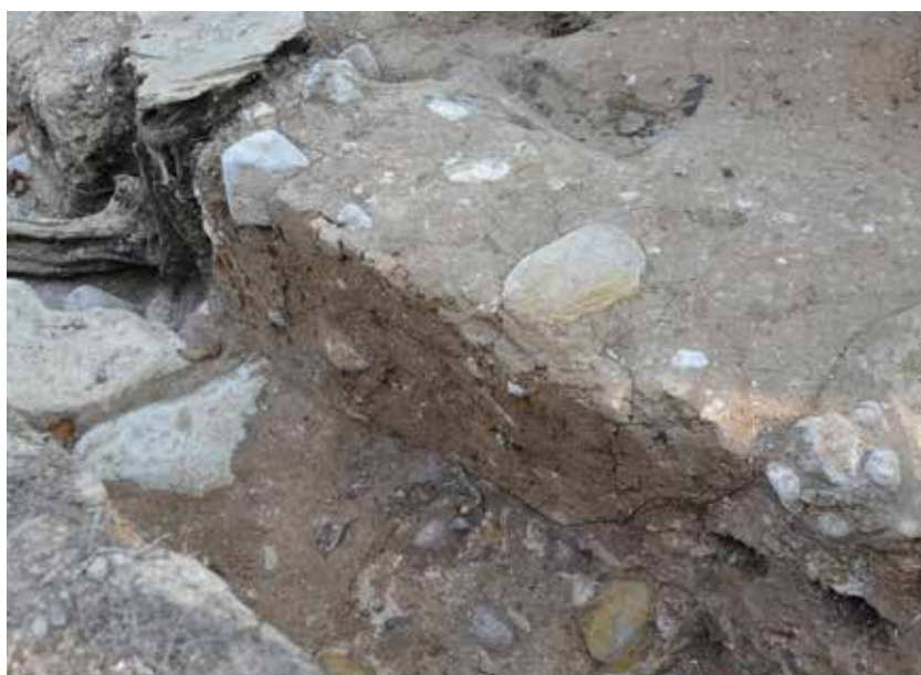
3 埋葬施設 墓壇南端部埋土断面 南西から