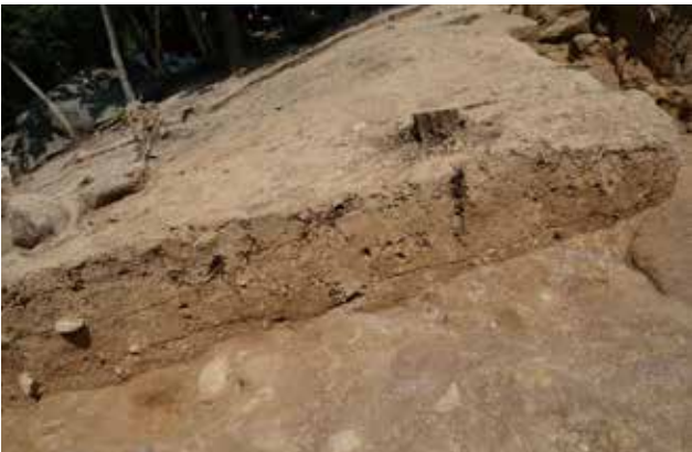
4 北側区画溝 L-L'ライン標高75m以上 南から