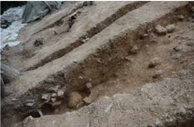
2 北側区画溝 L-L'ライン標高73m以下 南から