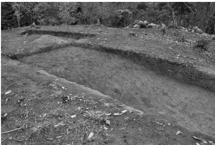
1 仙谷 1 号墓東側 6T・11T 調査終了状況 北から