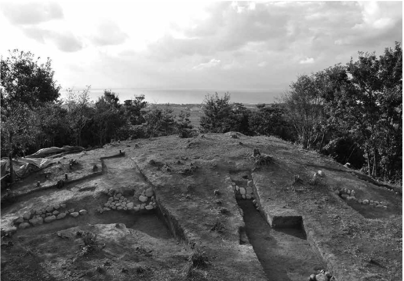
2 調査終了状況 東から