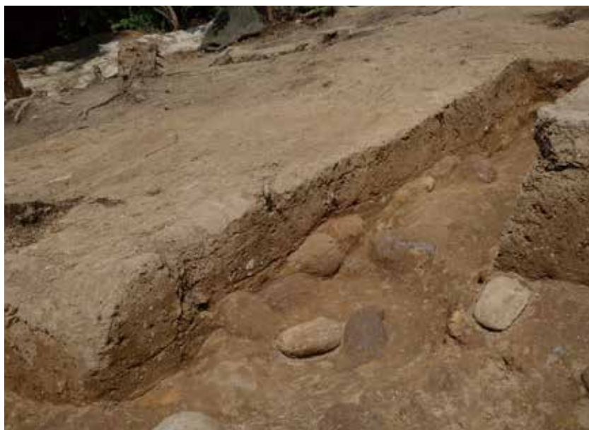
2 北側区画溝 L'-M ライン 南東から