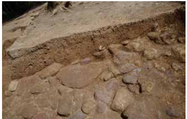
5 北側区画溝 N-N'ライン 南から