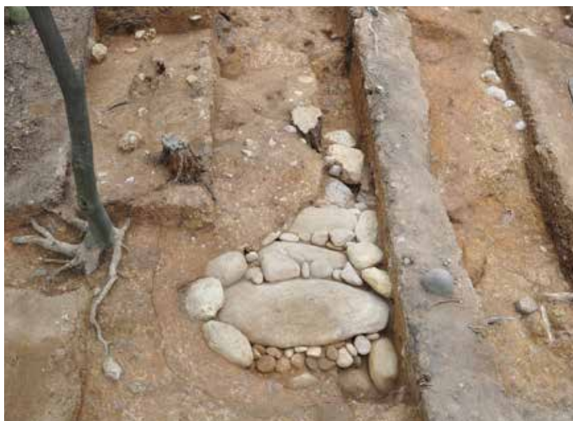
2 埋葬施設 墓壇検出状況 北西から