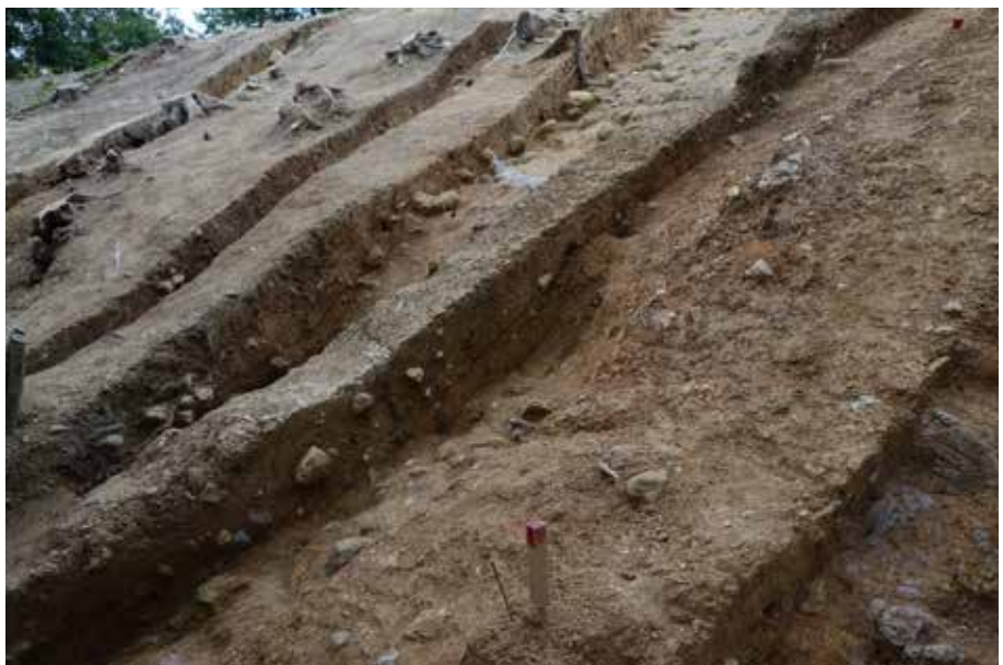
3 K-K'ライン 南から