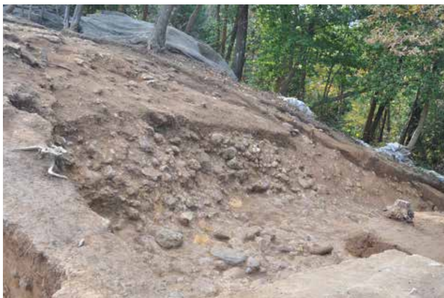
3 北側区画溝 西側調査終了状況 北東から