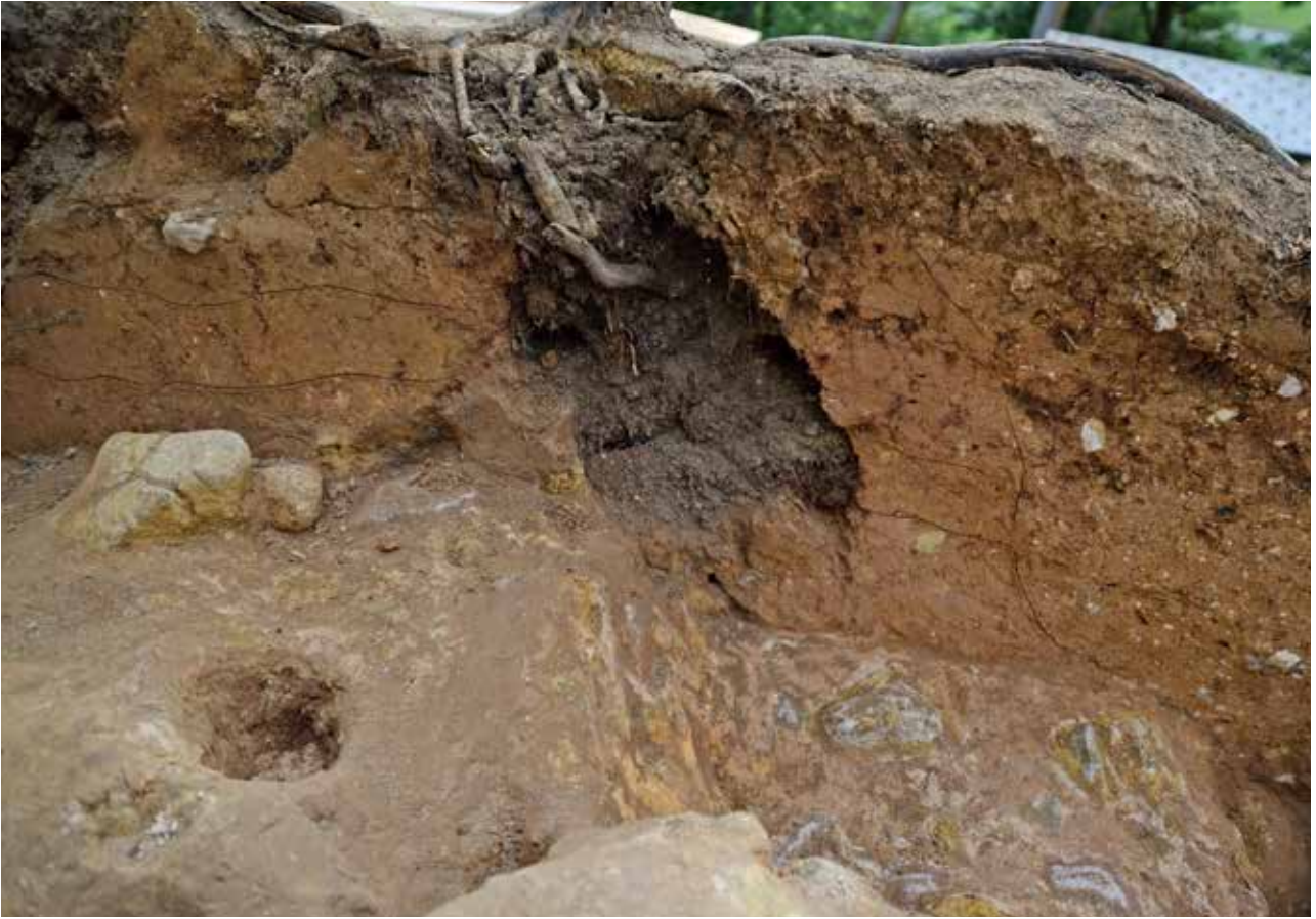
1 墳丘盛土及び埋葬施設墓壙埋土 Y-Y'ライン 北東から