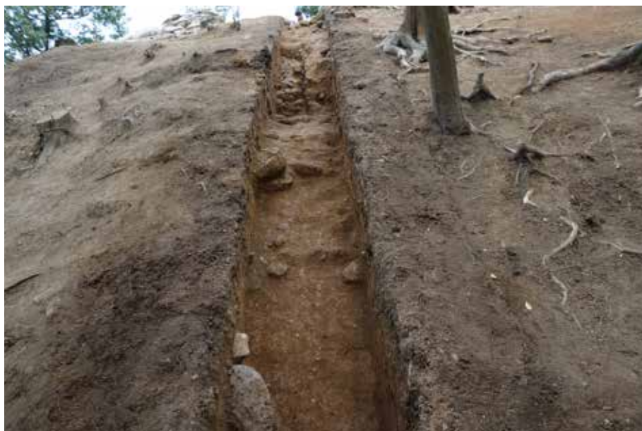
1 H-H'ライン トレンチ調査終了状況 南西から