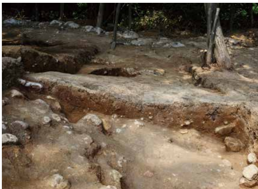
3 北側区画溝 W-W' ライン 東から