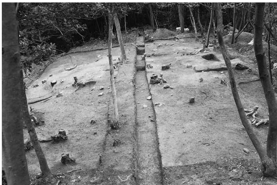
2 B地点S7調査後 南から