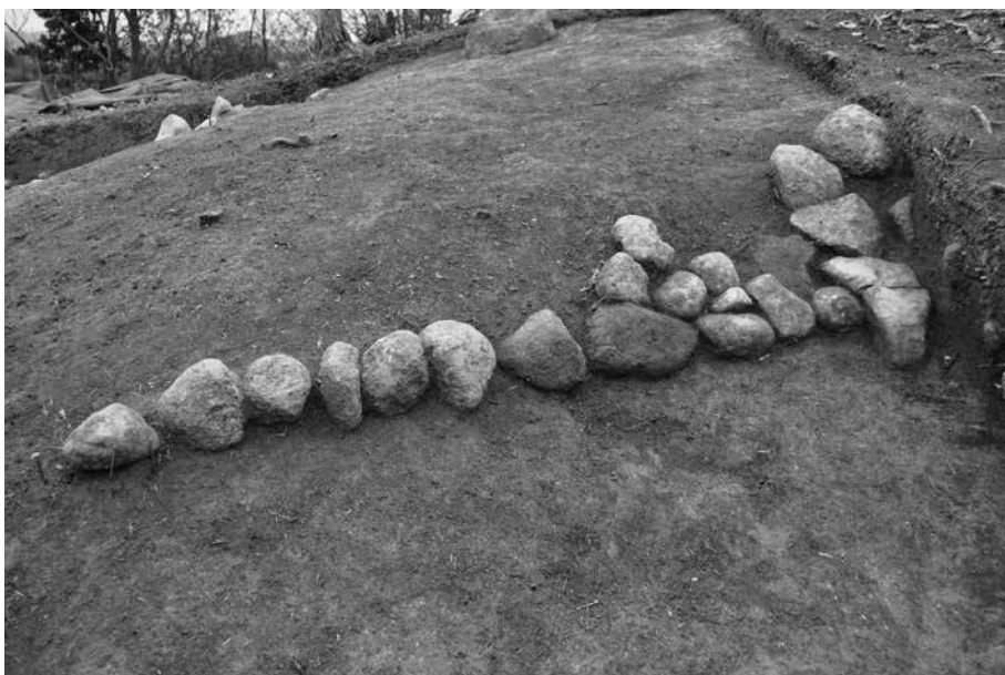
2 北東側突出部 北辺貼石検出状況(9T) 北西から