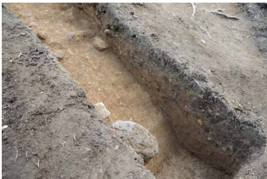
3 H'-Hライン 標高75m以下 北西から