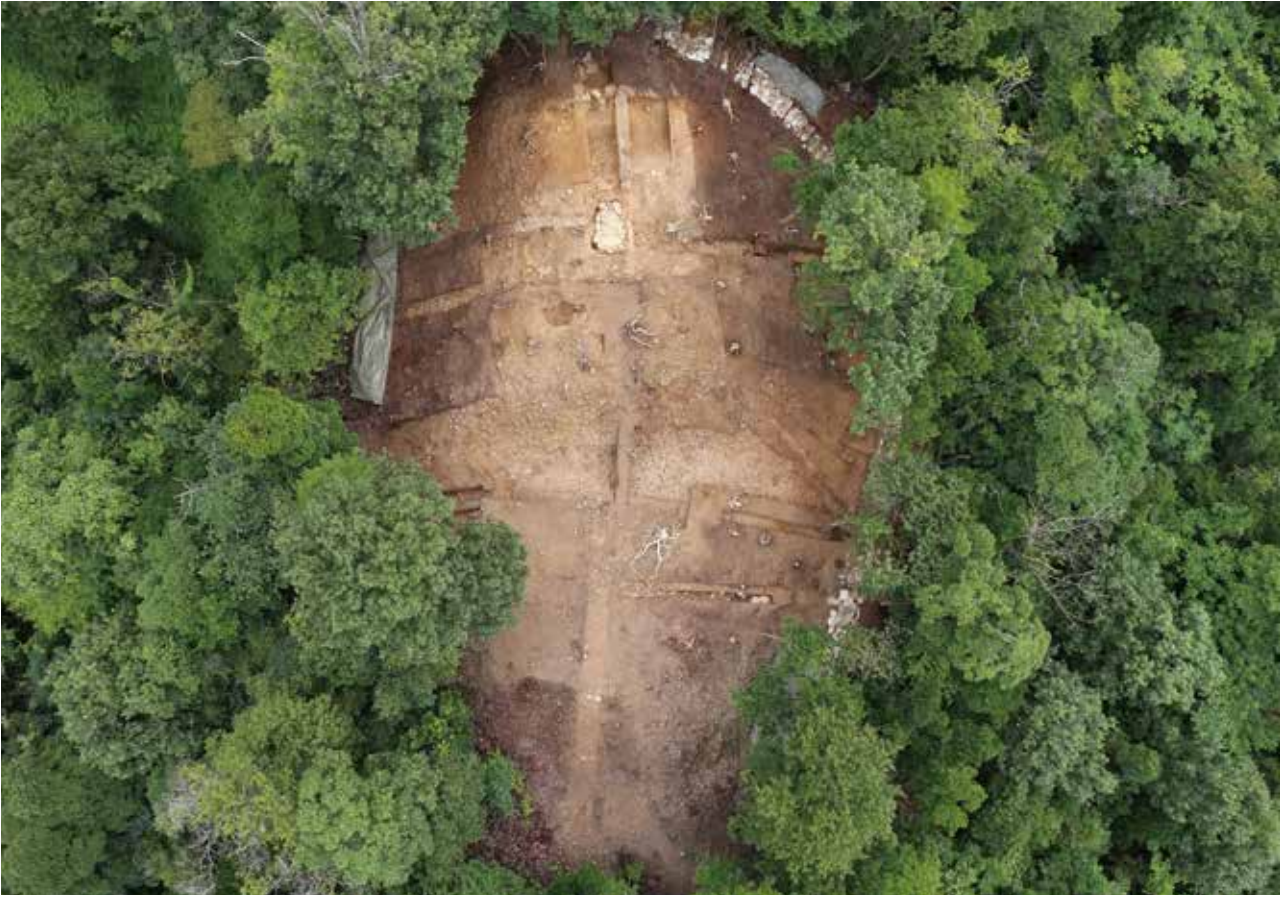
1 仙谷8号墓・9号墓 俯瞰（写真上が南）