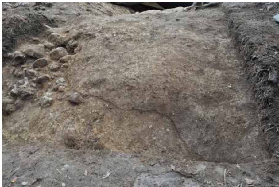
2 北側区画溝 北東側埋土上面検出状況 北東から