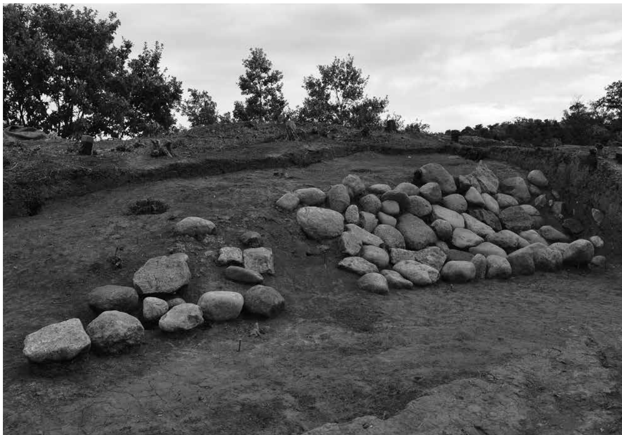
2 南西側墳裾検出状況（3T・4T）南西から