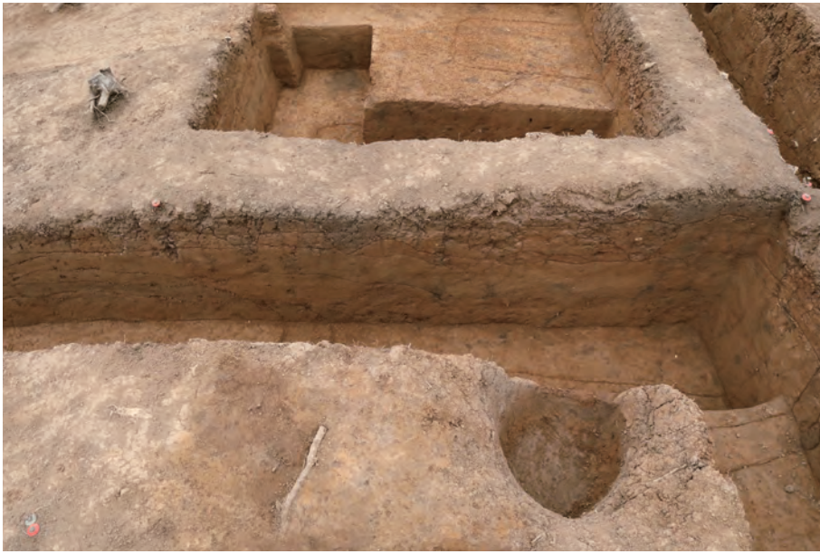
1 墳頂部東側トレンチ 南側土層断面 (D-D') 北東から