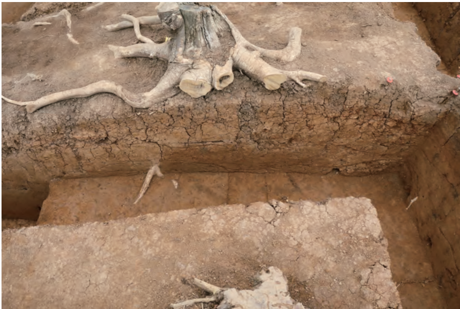
2 墳頂部西側トレンチ 北側土層断面 (D-D') 南西から