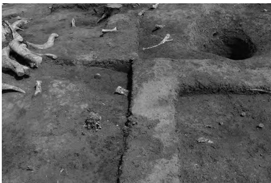
3 墳頂部トレンチ調査前 (17土坑完掘) 状況 北東から