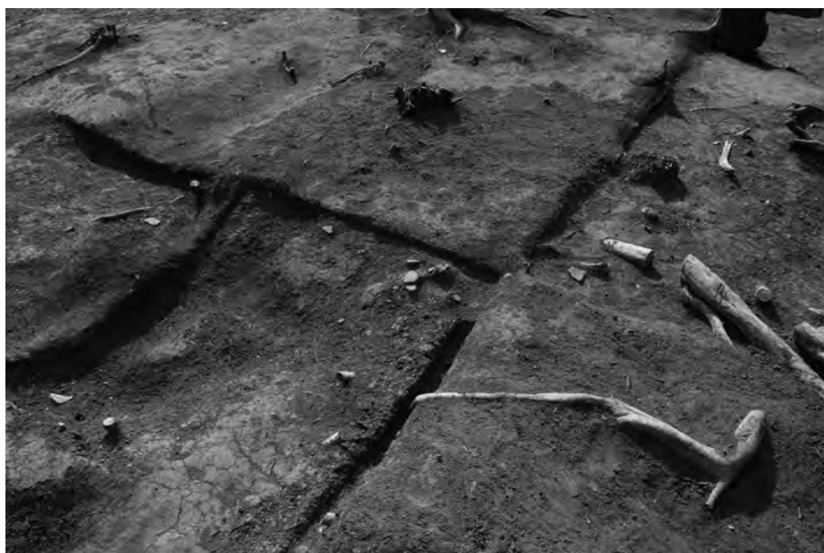
1 墳頂部遺物出土状況① (第33次調査時点) 北から