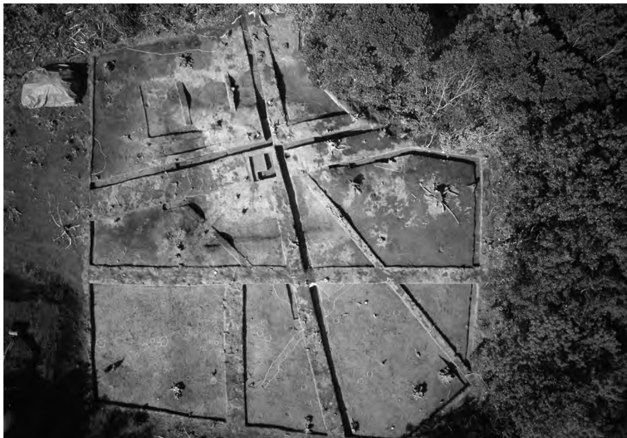
2 松尾頭10区北東部 調査区全景 俯瞰（上が北西）