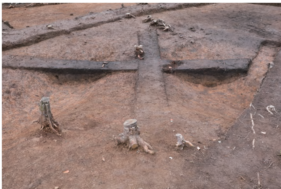
3 南東側陸橋部検出状況 北から