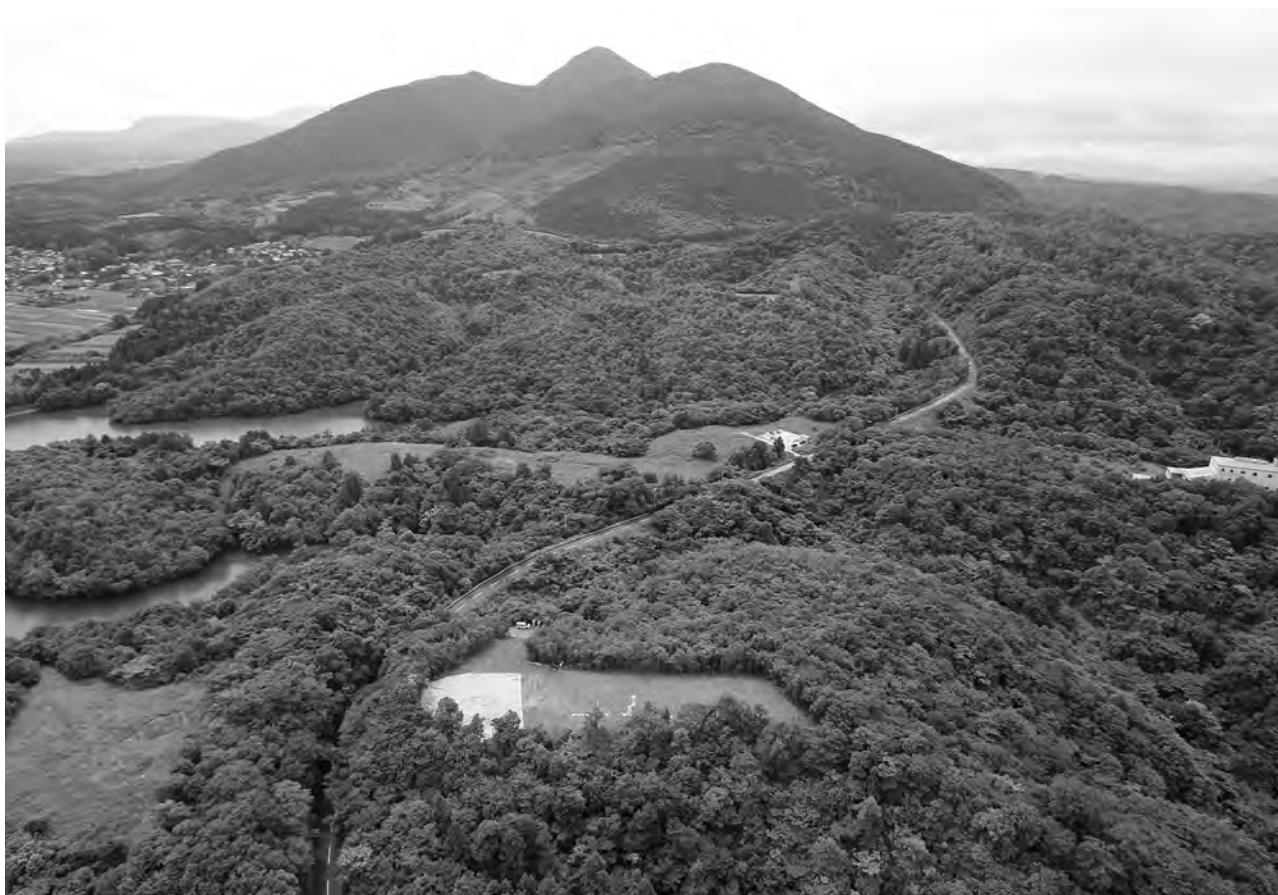
1 松尾頭地区全景 北西から