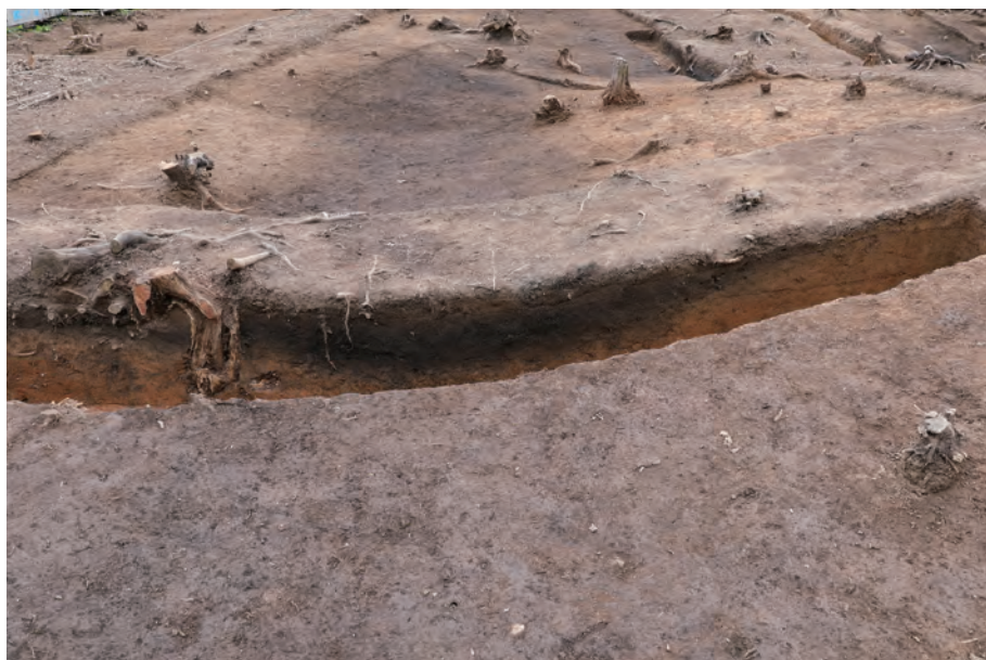
2 東側周溝 土層断面 北東から