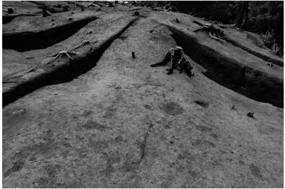
1 北東側陸橋部検出状況 南西から