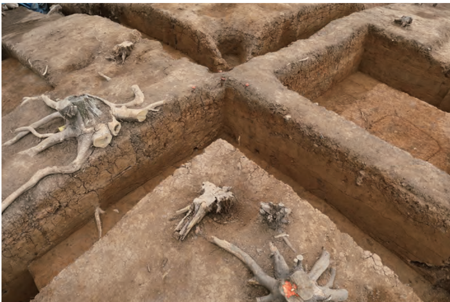
3 墳頂部トレンチ断面 断面交点西 西から