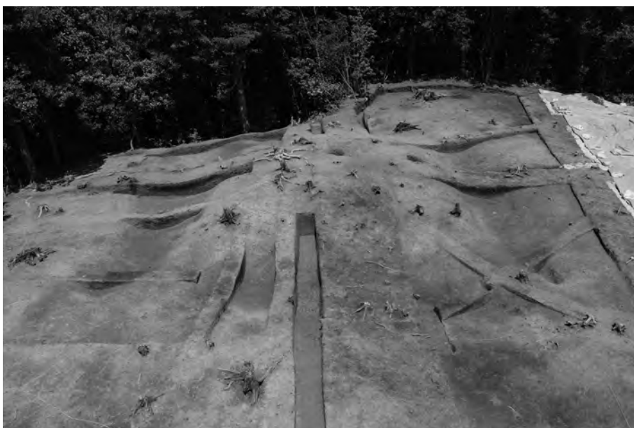
3 周溝完掘削状況 東南から