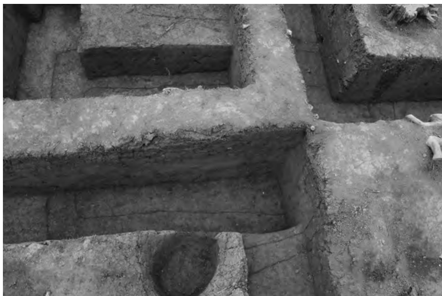
2 第1埋葬施設検出状況 北東から