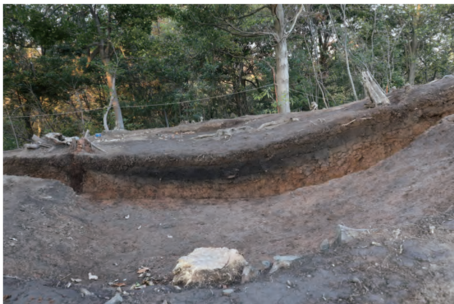
1 西側周溝 土層断面 南西から