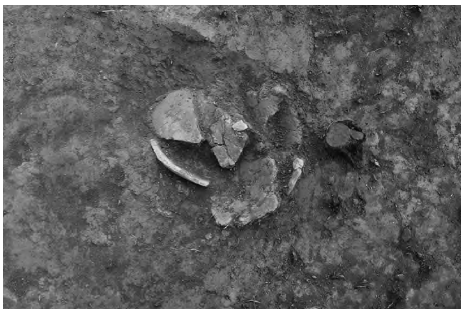
3 西側周溝遺物出土状況③ (周溝埋土2層下面) 俯瞰(上が北東)