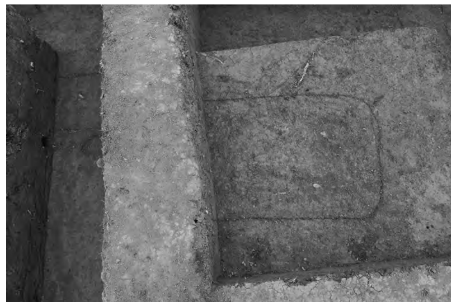
3 第3埋葬施設検出状況 北西から