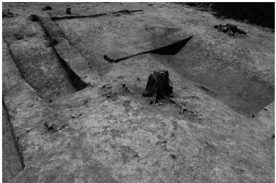
3 南西側陸橋部検出状況 北東から