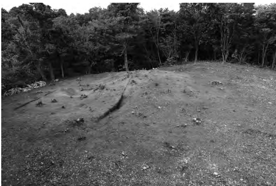
1 調査前状況 南から