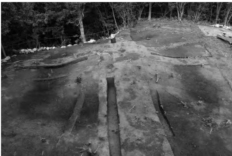
2 周溝検出状況 東南から