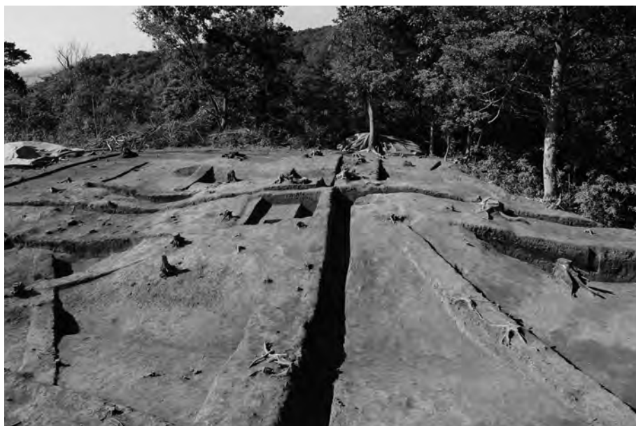
1 調査終了後 全景② 南から