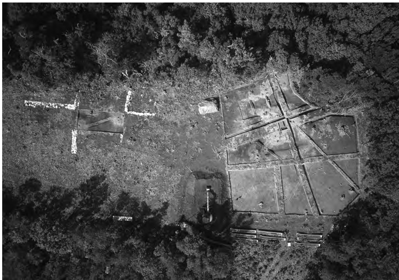
1 松尾頭3号墓・4号墓・5号墓 俯瞰（上が北西）