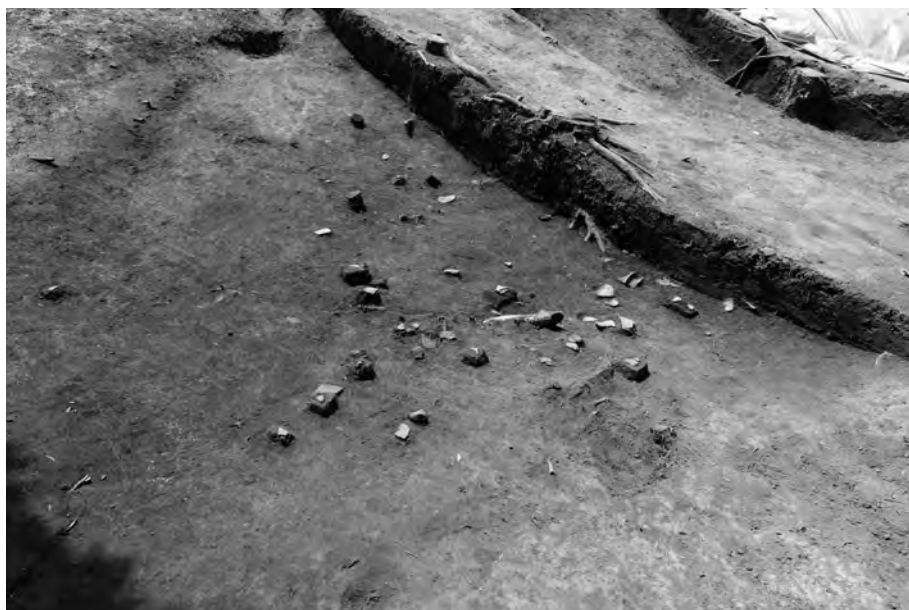
1 西側周溝遺物出土状況① (周溝埋土1層下面) 北から