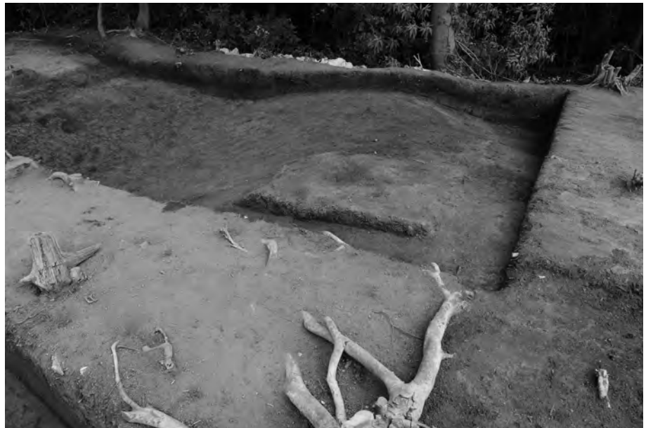
2 北西側陸橋部検出状況 南から