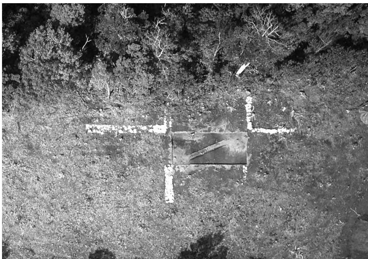
2 松尾頭4号墓・5号墓 調査終了後全景 俯瞰（上が北西）