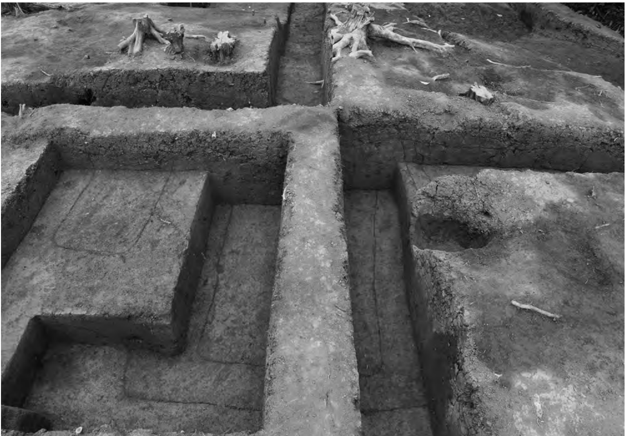
2 埋葬施設検出状況 南東から