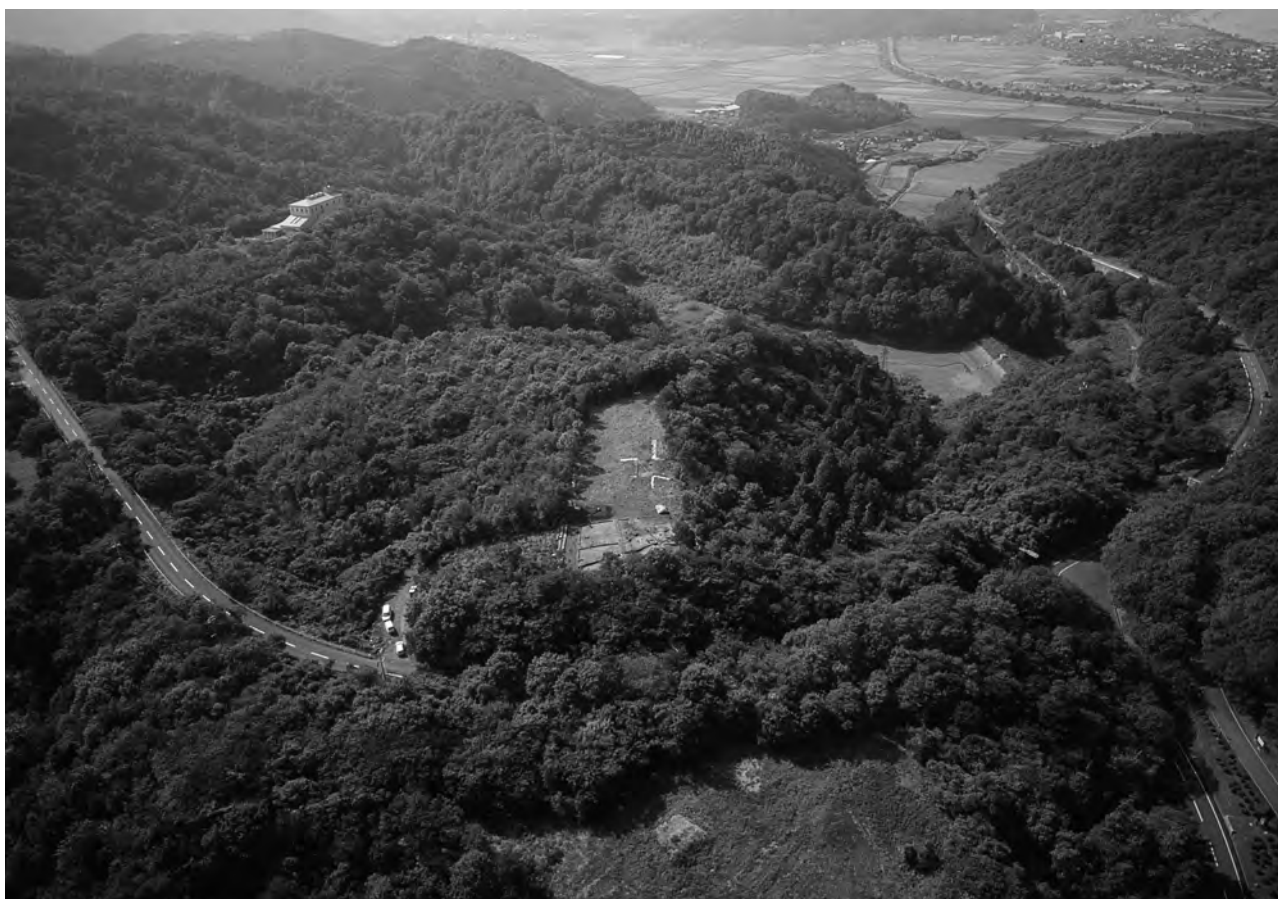
2 松尾頭墳丘墓群遠景 北東から