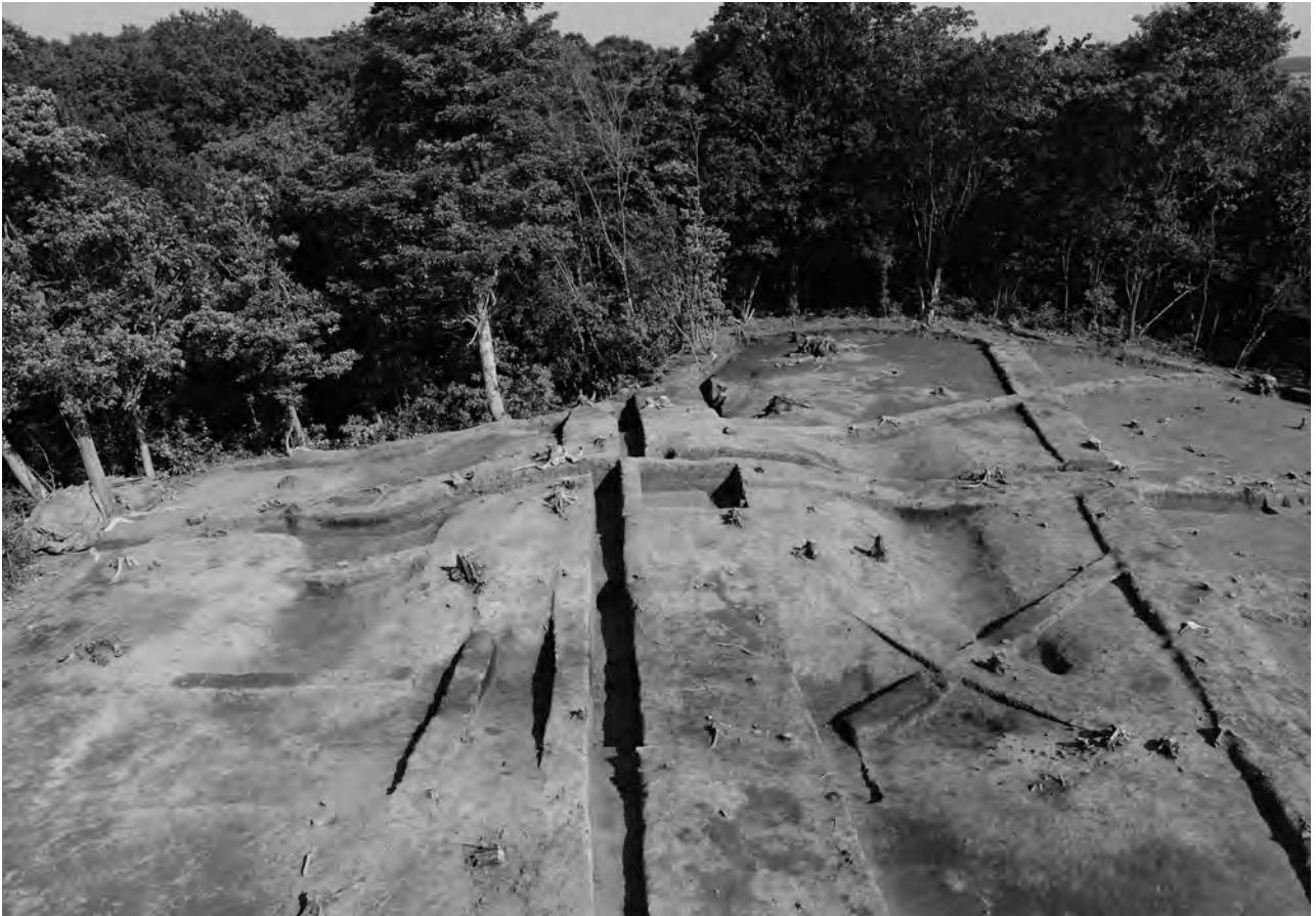
1 調査終了後全景① 南西から