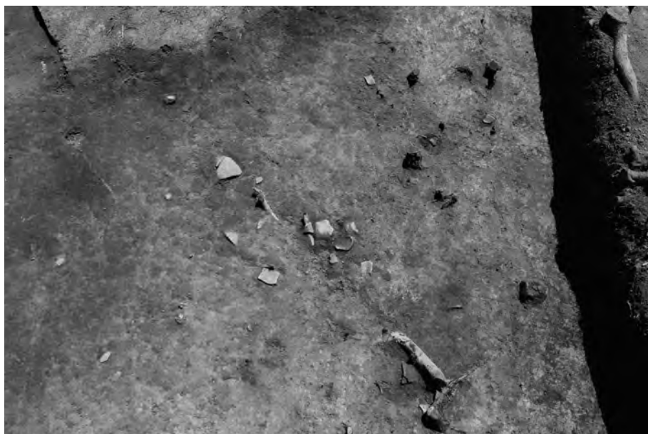
2 西側周溝遺物出土状況② (周溝埋土2層中) 俯瞰(上が北東)