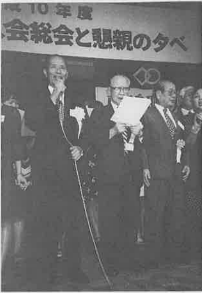
写真は、平成10年9月の総会で「ふるさと」の歌を唱う西尾知事(左)と右へ佐々木顧問、天野副会長

去る1月19日、東京鳥取県人会の新年幹事会が行われ、来賓で出席された西尾知事は、自ら知事退任の意を明かされた。いつも