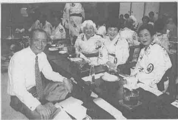
写真は、平成9年7月三朝温泉齊木別館で、東京鳥取県人会の夫人たちと談笑する西尾知事