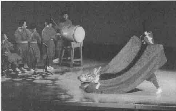
麒麟獅子舞 (智頭農林高校)

道路がよくなり、車の数が急激に増えたこと、そして人々の服装が見違えるほど都会的になったこと等々である。その上車窓には次々と人民服を着て、規制の厳しかった中国か?と目が