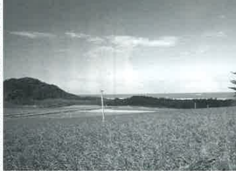
▼鳥取砂丘に咲く、鳥取市の花「らっきょうの花」

鳥取市の東部に位置する鳥取市は、中国山地から日本海へ北流する千代川流域にひらけた鳥取平野に、古くから城下町として生まれ、江戸時代は鳥取藩池田家32万石の城下町として栄えました。