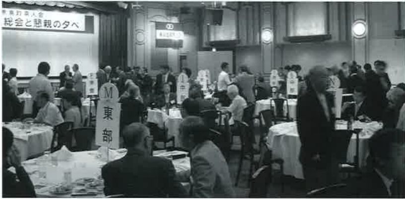
▼総会と懇親の夕べ全景