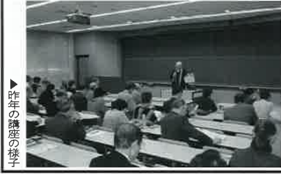
▼昨年の講座の様子

明治大学・鳥取県連携講座が10月7日から開設されました。鳥取・遺跡から読み解く歴史と文化