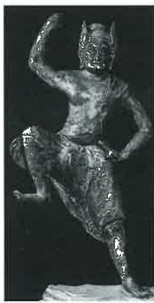
重文 木造蔵王権現立像

この夏から秋にかけて、三徳山の幻想的雰囲気を出して、開山1300年を記念したイベントが、投入堂修復落慶法要・三徳山年祭のイベントが、重文の「文殊堂・地藏堂」の炎の祭典も行なわれる。特別公開もあつた。この10月