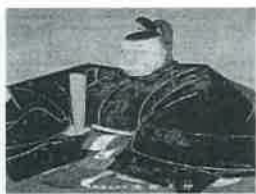
▲鳥取藩主初代 池田光仲

10月18日、東海大学において、鳥取県と東海大学が連携して、鳥取県と岡山県の連携が藩主で、初代藩主は従兄弟