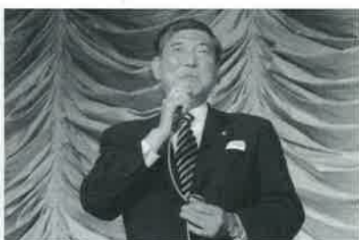
▲総裁選の最中に駆けつけてくれた石破茂農林水産大臣