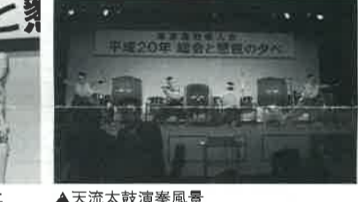
▲天流太鼓演奏風景