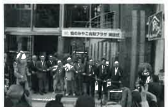
▲アンテナショップのオープン風景

2008年11月20日発行 東京鳥取県人会事務局 〒102-0093 東京都千代田区平河町2-6-3 都道府県会館10F 電話 03(5212)9178 FAX 03(5212)9079 発行責任者 / 上村正明 編集 / 県人会広報部会 http://www.pref.tottori.lg.jp/tokyoffice