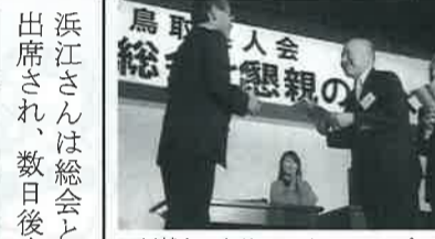
▲川越とつりコンベンションビューロー事務局長(左)より賞品を受ける会員