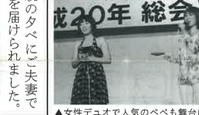
▲女性デュオで人気のペベも舞台上に