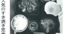
▲人気のすき焼き定食

また地域に「石神井店」もあって筆者はよくそこを利用しているのだが、池袋店はこれまでと店作りが雰囲気が違っていることに気が付かれたのである。近年、池袋に若者たちが戻ってきたという話だ。池袋の三越店と道を挟んでメガネストアの有るビル6階にエレベーターで昇る。ドアが開いて、すぐ衝立の向うに客席が並び、右手窓際の8席は池袋の街中を展望する特等席。左手中央に、柳の木を模した飾り木を中心に6角形に12席並ぶいすれもカップル兼用席である。